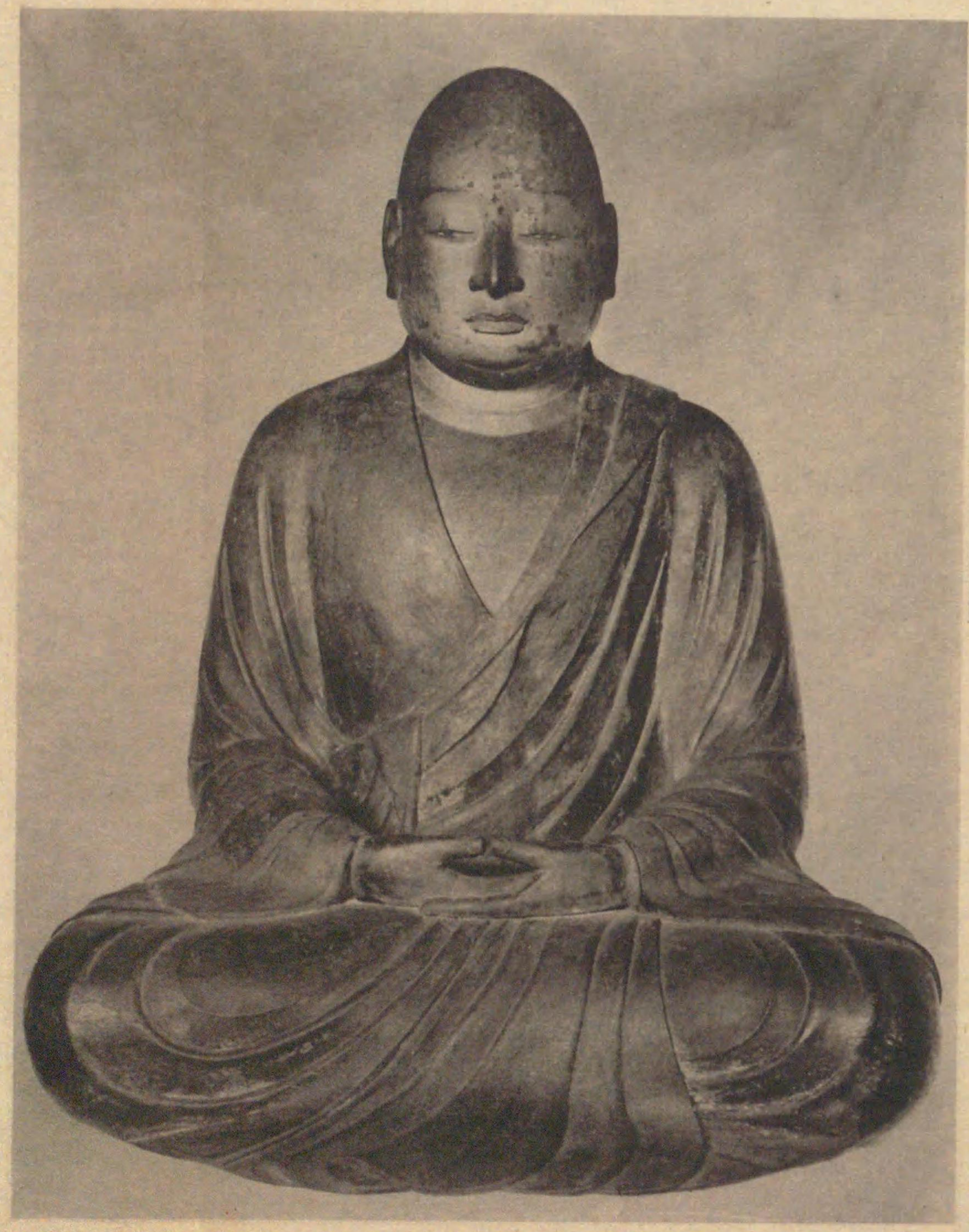
圓珍木像 近江園城寺唐院安置