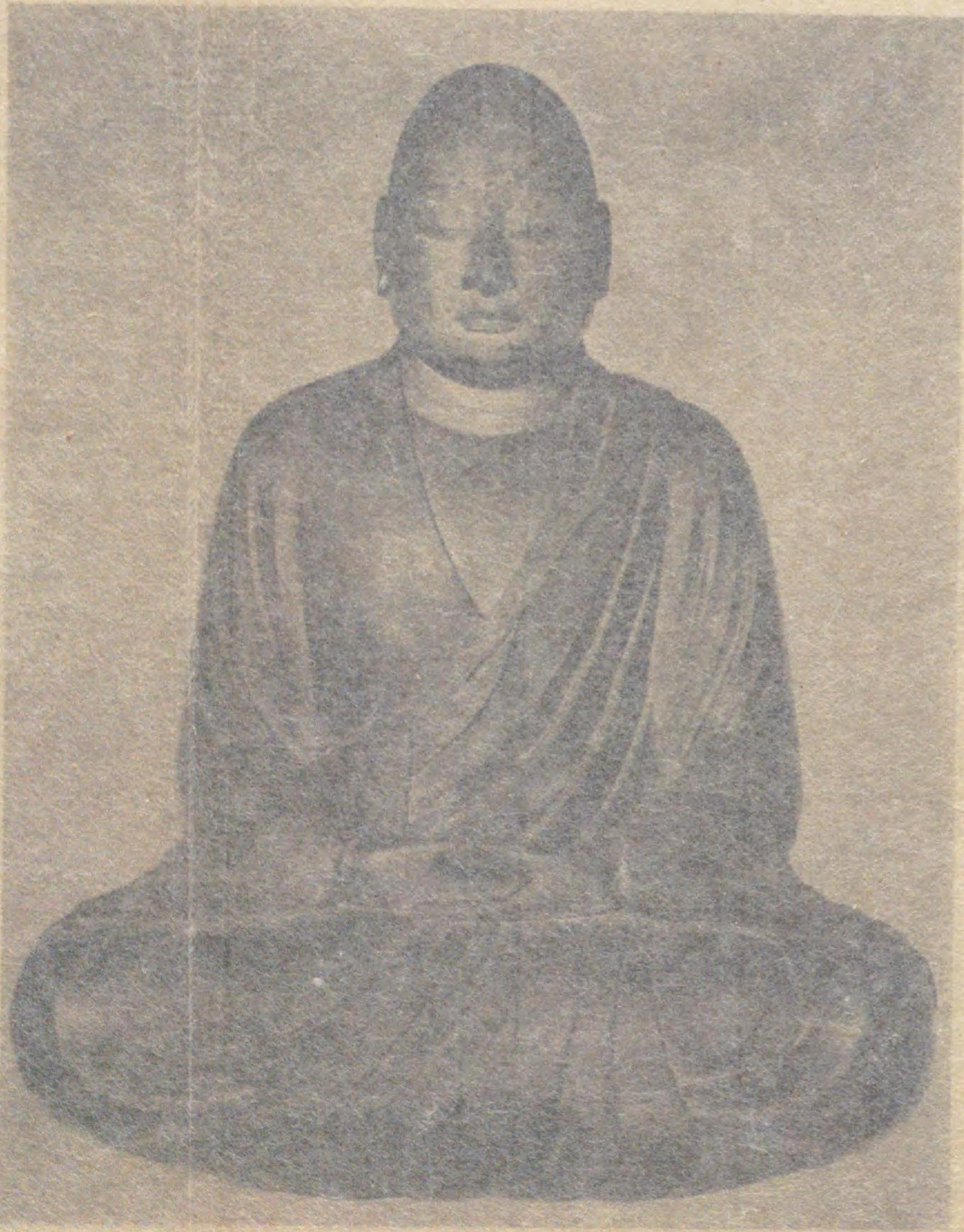
圓珍木像 近江園城寺唐院安置