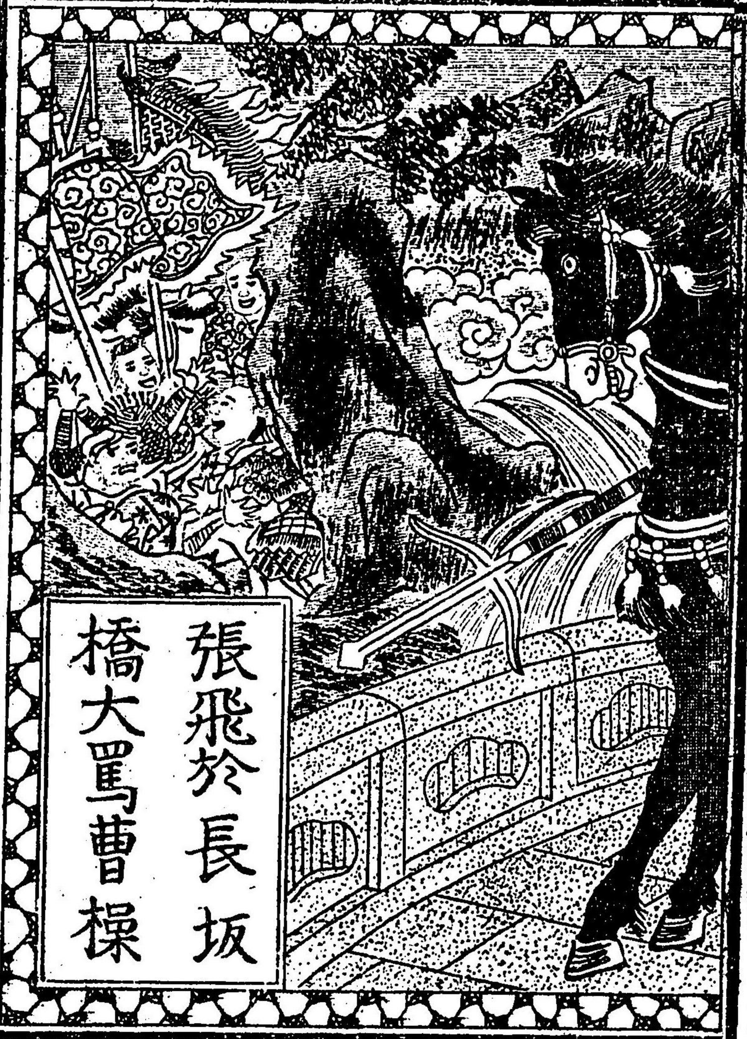
張飛於長坂 橋大罵曹操