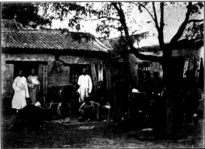
成安縣自新工藝所

成安東界大名廣平南與河南臨漳接壤素為盜賊出沒之區現署該縣石令以欲清盜源必興教育迺設立工藝所農工廠分撥賊犯習藝種植其有藝成及悔過自新者年終考察准其取保回家自謀生業化莠為良用意甚善茲以工藝所農工廠兩圖排日登報以資觀感