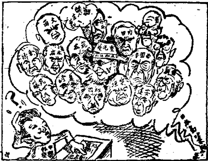
• 紛擾的局面多在其中！

爭，掀起東亞局勢的變化，則列強為其自身之遠東利益故，對於暴日此種足以破壞列強遠東利益的侵略行為，勢必加以干涉。即或此種要求為不可