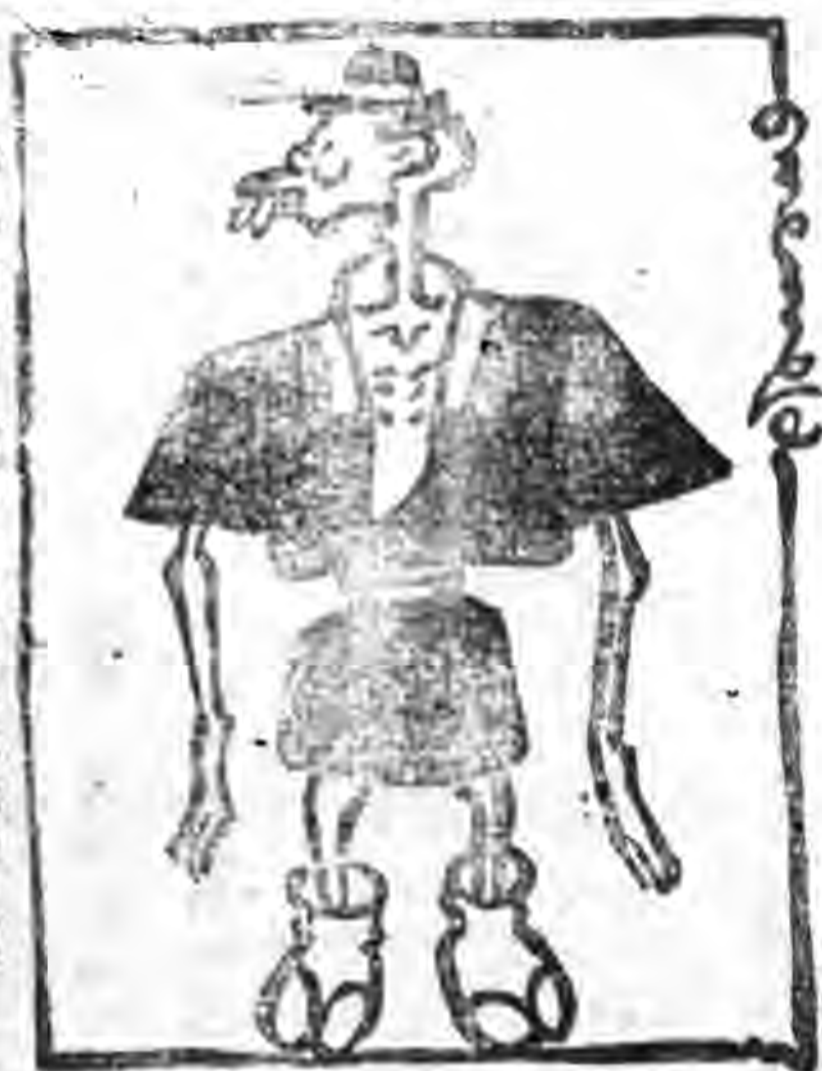
日本民衆說：我的衣服一天天寬起來了！