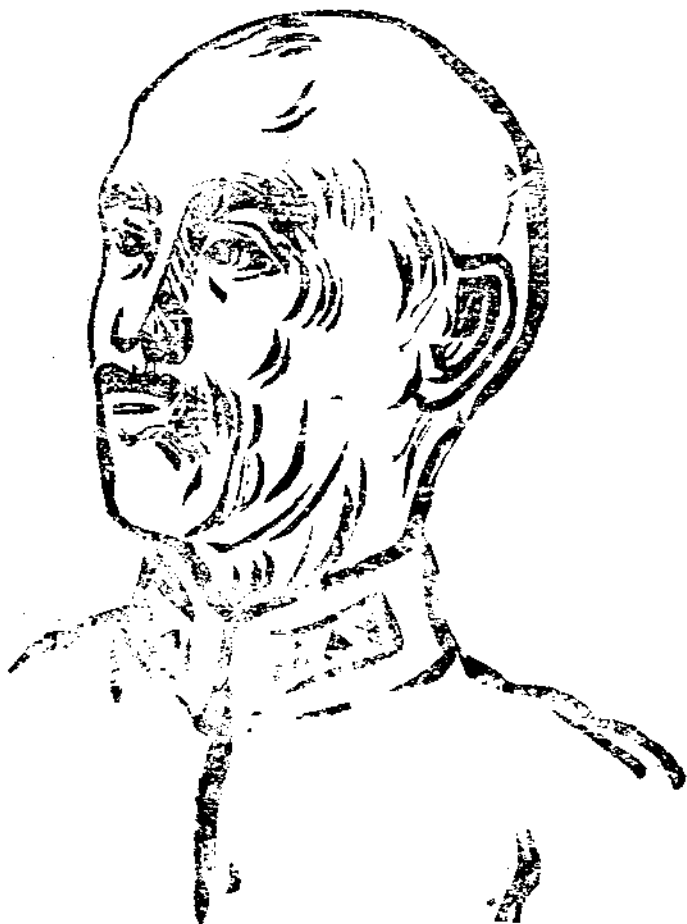
總 蔣 像

自從對日抗戰發動以來，這三年又八個月的時間，我們前線將士艱苦奮鬥，全國同胞一致興起，無感不表現我中華民族偉大的革命精神。自從精神總動員綱領發布以來，我們全國同胞的精神更見振作，更見發揚，也更沉着而堅定了；尤其淪