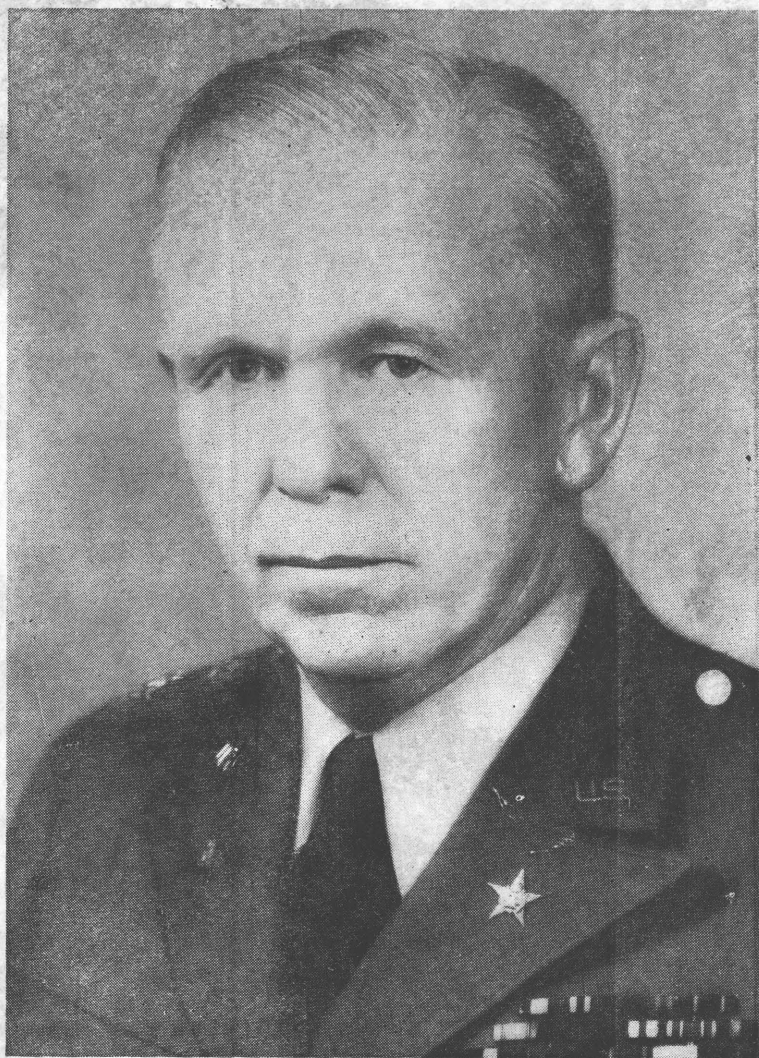
美國駐華特使馬歇爾將軍近影