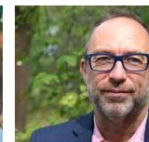
Jimmy Wales Trustee