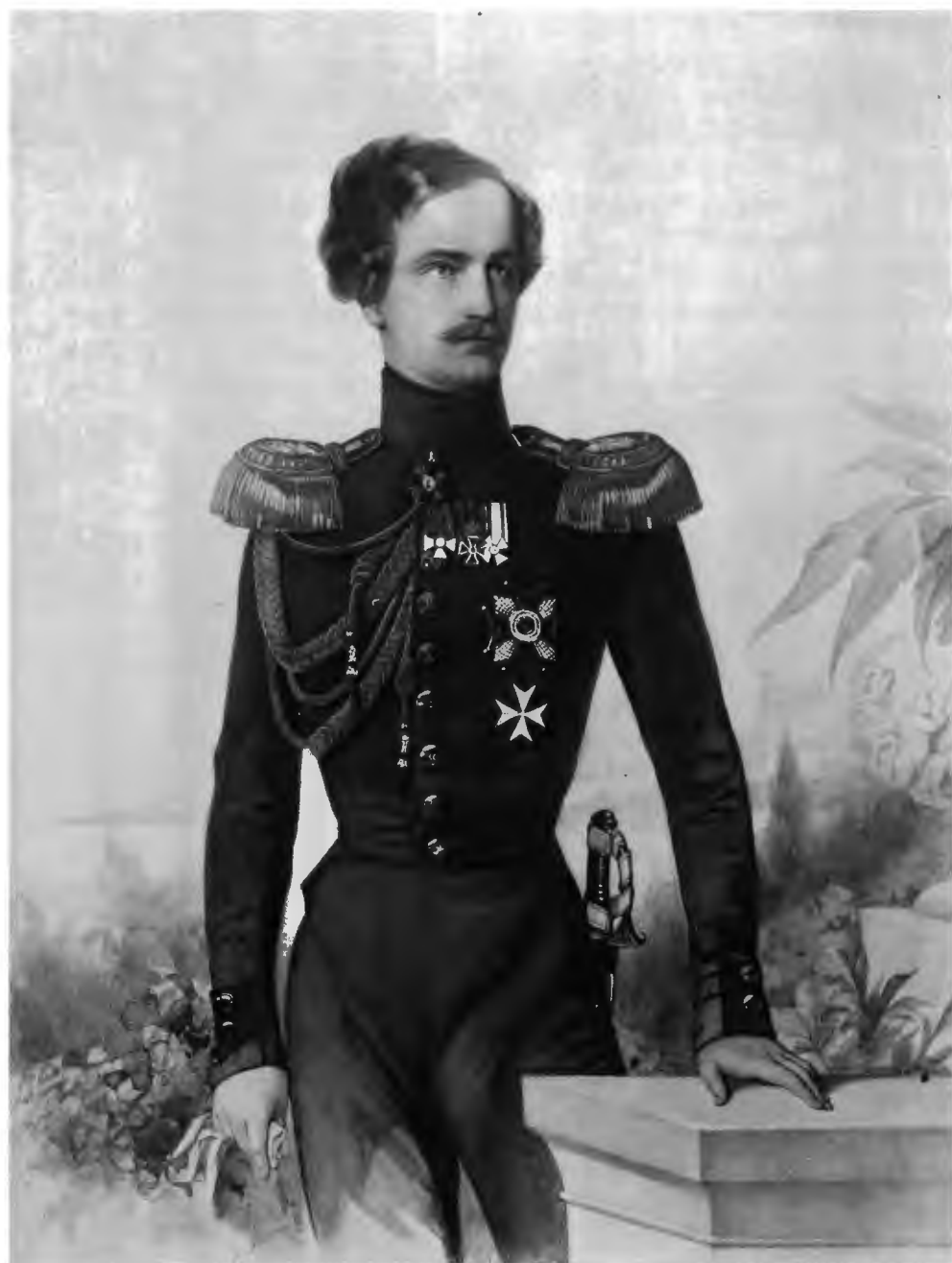
Фото-Гравюра Шерера, Набгольцъ и С я въ Москвѣ.