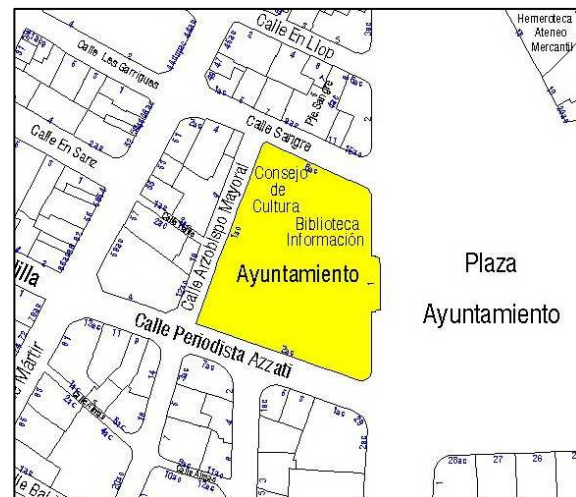
Parcelario Municipal 2009 SIGESPA