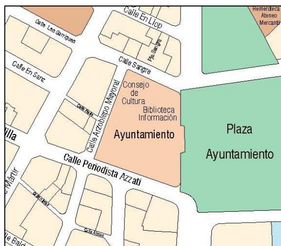
Planeamiento Vigente Sigespa 2009