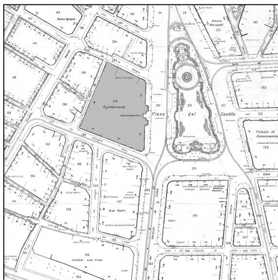
Cartográfico Municipal 1929 - 1945

Ya en el presente siglo y concretamente durante la Segunda República, el Templo de Santa Rosa y sus dependencias anejas, sufrieron una profunda transformación con el fin de instalar definitivamente el Archivo y Museo Histórico de la Ciudad. En el otro extremo de la manzana, se encontraba la Iglesia de la Sangre. El interior de esta parte del edificio es el que mayor transformación a sufrido en su conjunto, ya que entre 1942- fecha de adquisición definitiva por el Ayuntamiento- y 1950 se llevan a cabo las obras necesarias para el derribo total de lo que quedaba del templo y se construyó un amplio patio acristalado, cambiando totalmente la distribución y fines del antiguo solar. La fachada no ha sufrido alteraciones en su aspecto externo, conservando las cuatro puertas principales, aunque solo una de ellas sea accesible actualmente, precisamente la de la antigua iglesia.