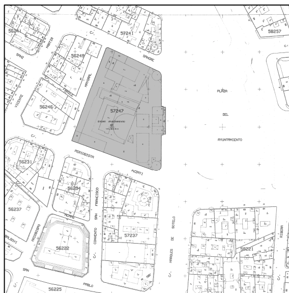
Cartográfico C.G.C.T. 1980