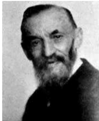
Giuseppe Peano (1858 -1932)

In den natürlichen Zahlen \mathbb{N} kann man addieren, multiplizieren, potenzieren, teilweise abziehen, es gibt die Größergleich-Relation, die Teilbarkeit, usw. Man kann sich nun fragen, welche Abhängigkeiten (logische Hierarchien) zwischen diesen mathematischen Strukturen bestehen und ob man manche davon auf andere, grundlegendere Strukturen zurückführen kann. Dies