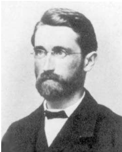
Richard Dedekind (1831 -1916)