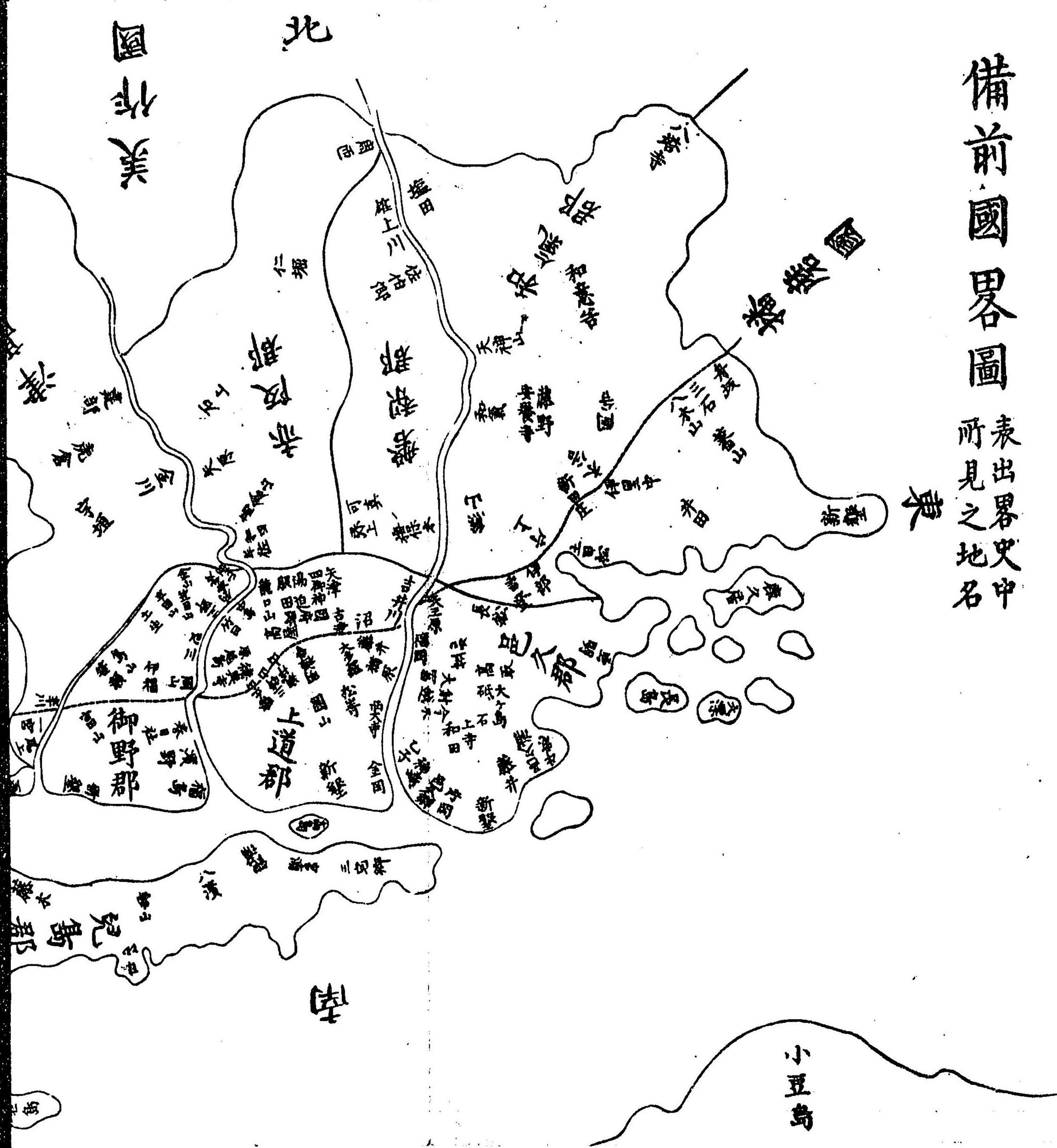
備前國畧圖 表出畧史中 所見之地名