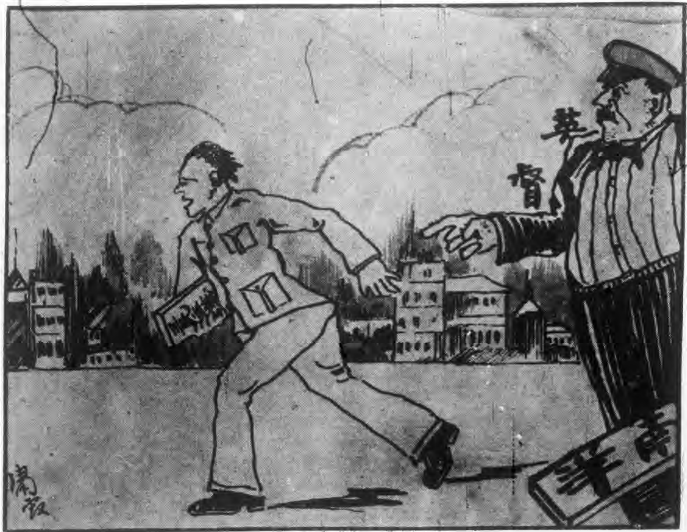
境出員人務黨我迫督英洋南