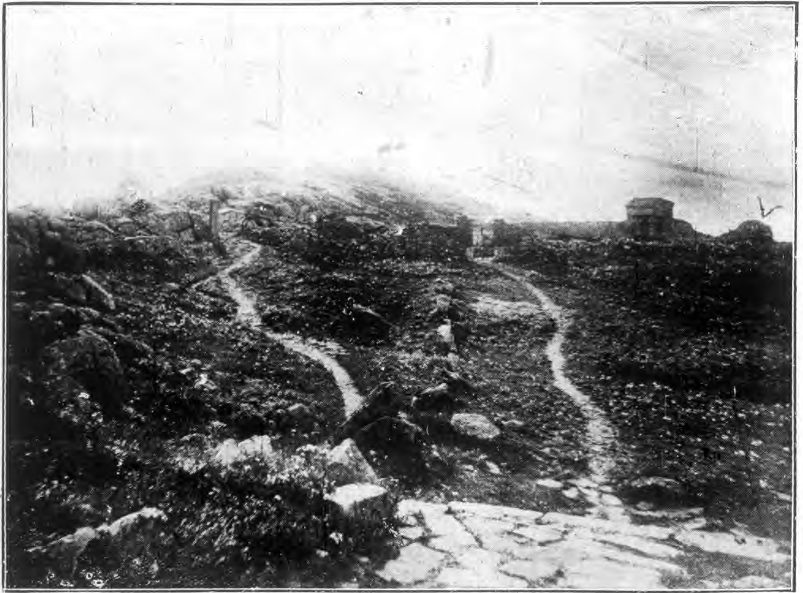
秦 山 日 觀 峯