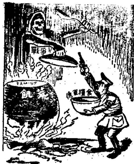
德國積聚更多的軍糧，造成歐洲的大饑

「上面談點，不過略舉其例。總之，敵人對我東北同胞，簡直比對待朝鮮人民還要苛酷，還要毒辣。東北同胞在此淫威之下，居住沒有自由，生活沒有自由，說話沒有自由，受教育沒有自由，婚嫁喪葬沒有自由，甚至行動一步，亦沒有自由。更慘痛的說一句，就是處置個人的生死，亦沒有自由。曾有一位東北同胞對着這位視察的朋友說：「寄語國內同胞，咱們死亦要作中國人，但是犧牲救國，勿失時機。像現在咱們在東北，要想殺敵報國，求得光榮的死，已不是容易的事。——這幾句話，簡單而沉痛，說盡了東北三千餘萬同胞的心境。在今天這個重要紀念日，我要喚起我們全國同胞，一致遙念東北同胞所受的痛苦。我更要把這東北同胞的鄭重寄語，特別告訴我們全國的同胞。我們全國同胞對於東北同胞的處境，當然是十分關懷的。我們九年來忍苦奮鬥，三年餘奮勇抗戰的目的，就為要恢復我們國家的獨立主權和領土，要解救我們三千餘萬的東北同胞。我們東北同胞的痛苦，因為關山隔絕，敵騎縱橫，我們國內所知道的或者還不及真相十分之一。可是我們全國同胞應該引東北同胞為前車之鑒。這位東北同胞所說的一犧牲救國，應當勿失時機。這一句話，實在是沉痛入骨。他的意思就是說要為國家民族貢獻生命，就要趁你手上有武器的時候來，誠要殺敵報國，就要趁你有國民政府領導的時候來報效，有力出力，有錢出錢，也要在行動自由的環境下及時發動，然後能够事半功倍，驅逐敵人，保衛祖國，復興民族。 「像現在我們東北同胞，民間武器全被收繳，軍隊中間層層統制，節節監視，雖然人心未死，也有不少英勇殺敵的事蹟，但是空拳赤手的反抗，要冒險與敵而為之，那就不容易驅逐敵人，更不容易制敵人的死命。因之我們同胞必須知道，我們現在雖然遭受敵人的轟炸、燒殺和種種破壞，而在東北同胞看來，正如人間之仰望天上，我們現在前線的將士和後方的同胞，流血流汗，拚命努力，很多人為國捐軀，因公殉難，這些光榮的犧牲，在東北同胞看來，乃是求之而不可得。想到這裏，我們應該如何同情東北同胞的痛苦！我們更應該如何珍重我們自身的責任。這種時候，人人不辭犧牲，一切來求得我們國家民族世代子孫獨立自由的幸福，我們更須知道敵國所唱的「東亞新秩序」，他的目的，就是要使我們全國四萬萬同胞都和現在東北同胞