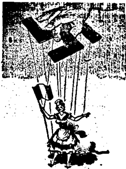
跟着「軸心」跳舞的法蘭西姑娘。

「全國同胞們，自從東北失陷，轉瞬已是九年了，我們回想想九年中間，不獨東北同胞受盡痛苦，我們整個國家也經歷了空前未有的悲難。但九年的悲難時期，轉瞬很容易的過去了，而我們是愈戰愈強，敵人是愈戰愈弱。我們要達到抗戰最後勝利，當然還要經過一段更多的艱難，更苦的奮鬥。但是我們撫今思昔，就可領悟到成敗興亡的至理，就可堅定我們最後勝利的自信，就更更感覺到我們在久遠的歷史中所負的責任。我在今天要爲我同胞說明