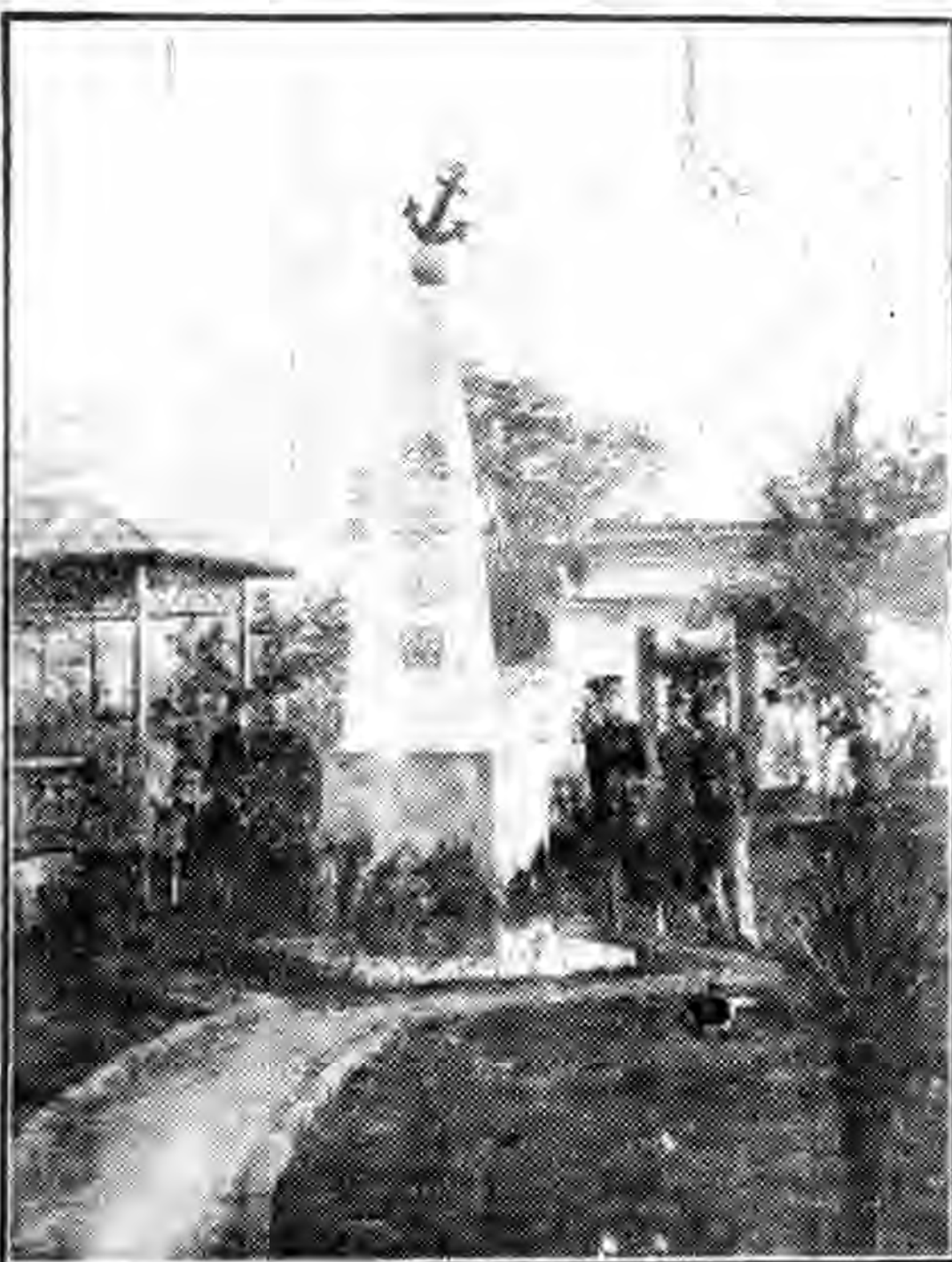
陸一旅一團兵工建築德安園落成攝影

機器部：製海水管各接頭，製機艙底水管各接頭，製機艙殘水管分路門箱，製吸燃油分路門箱，製吸燃油分路門箱，製進退機進汽門，製爐艙脫汽管各接頭，製副天氣抽出水分路門箱。翻砂廠：製注水管各截水門及各接頭，製70厘口徑吸燃油門一個，製起銷機脫汽管並副脫汽管安全并各一個，製第三爐之煤炭艙吸底水門，製總海底進水門，製重底水櫃吸底水門，製脫汽管各接頭，製機艙燃油管各接頭，製海水管及艙底水管各接頭。