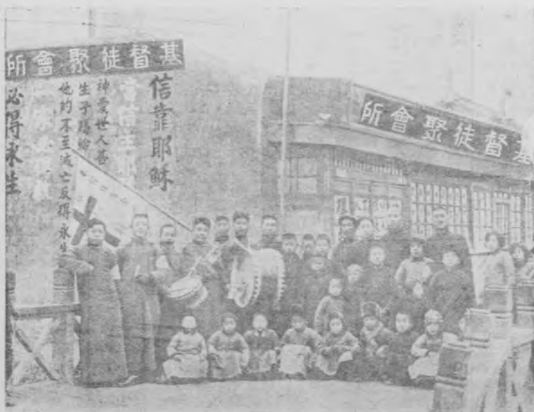
蒙神恩典在葛沽鎮新設立之基督教徒聚會所