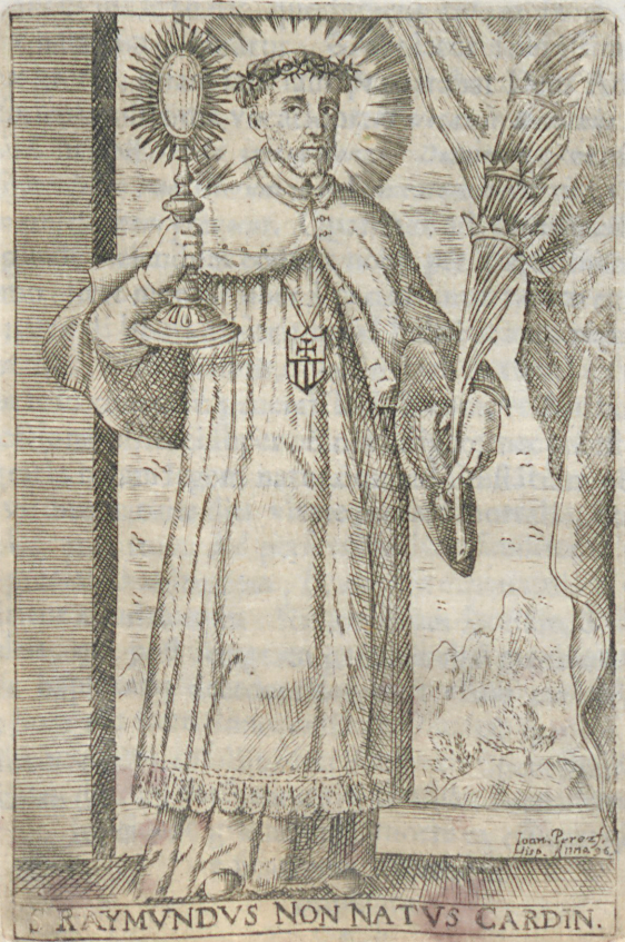
RAYMUNDVS NON NATVS CARDIN.