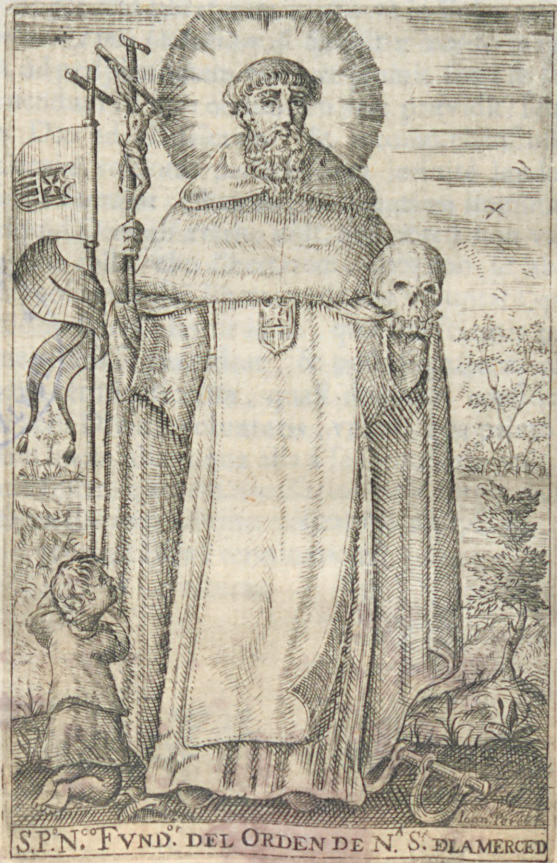
S. P. N.º FVND.º DEL ORDEN DE N.ª S.ª BLAMERCEDE