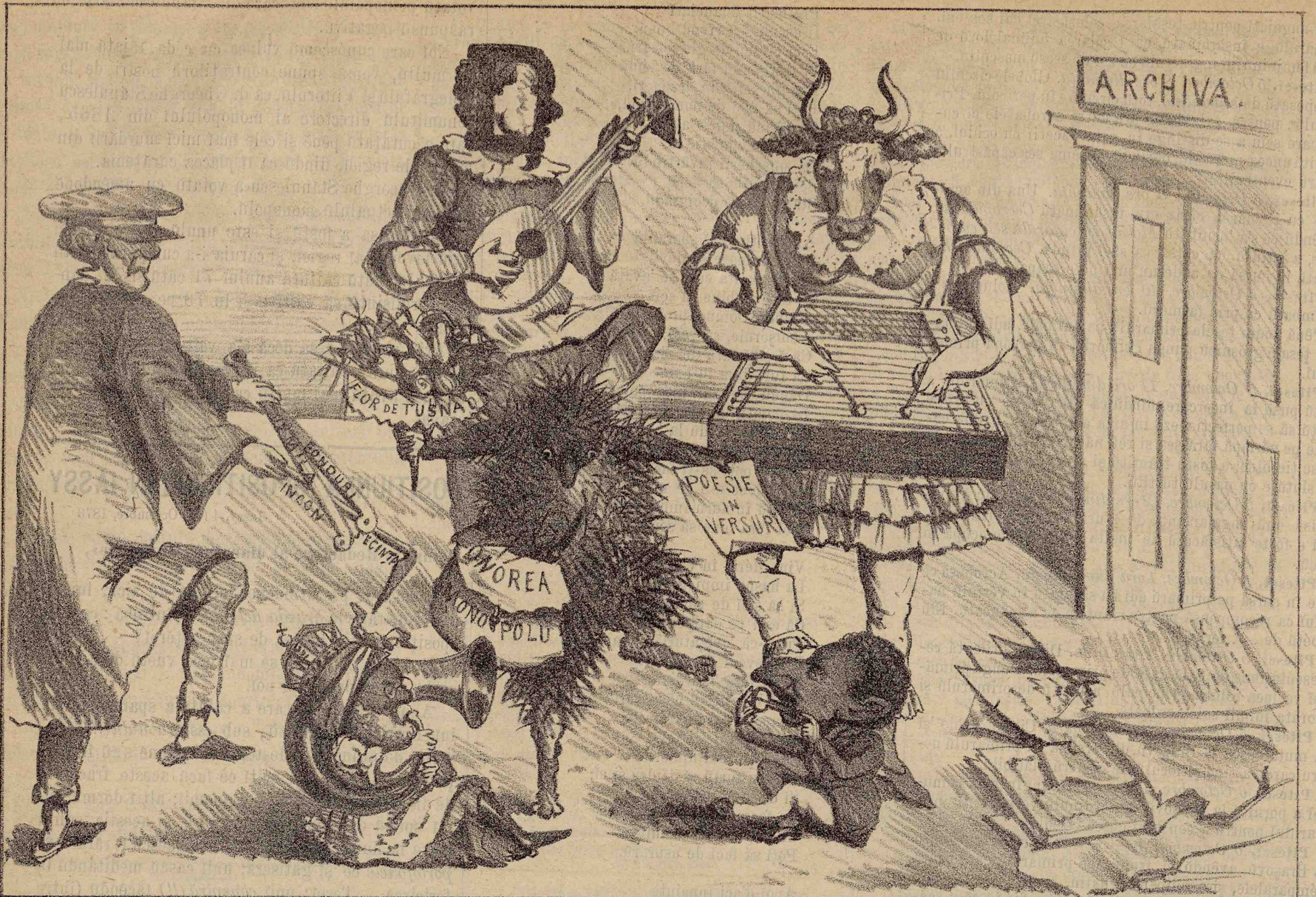
Admirațiunea ómenilor ordinii și pozițiunea arhivei statului dirigită de unú Arici-secú.