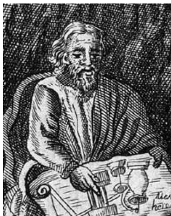
Heron von Alexandria (1. Jahrhundert n.C.)

Allgemein ergibt sich das folgende Heron-Verfahren.