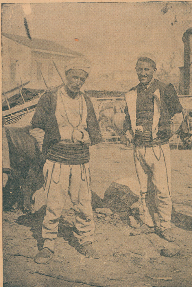
Сељаци из околине на пазару у Скопљу

На једном пропланку наиђемо на два коња, од којих је један био натоварен неким сандуцима,