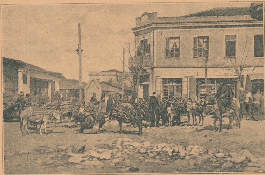
Пазарни дан у вароши Ђевђелији коју је српска војска освојила

и извалим се на његово дотадањем месту и, као етером успаван за операцију, заспим као мртав. Пробудио сам се тек сутра око пола десет сати, да бих још истог дана помиловао ушне бубњеве са тутњавом плотуна и праском бомби.