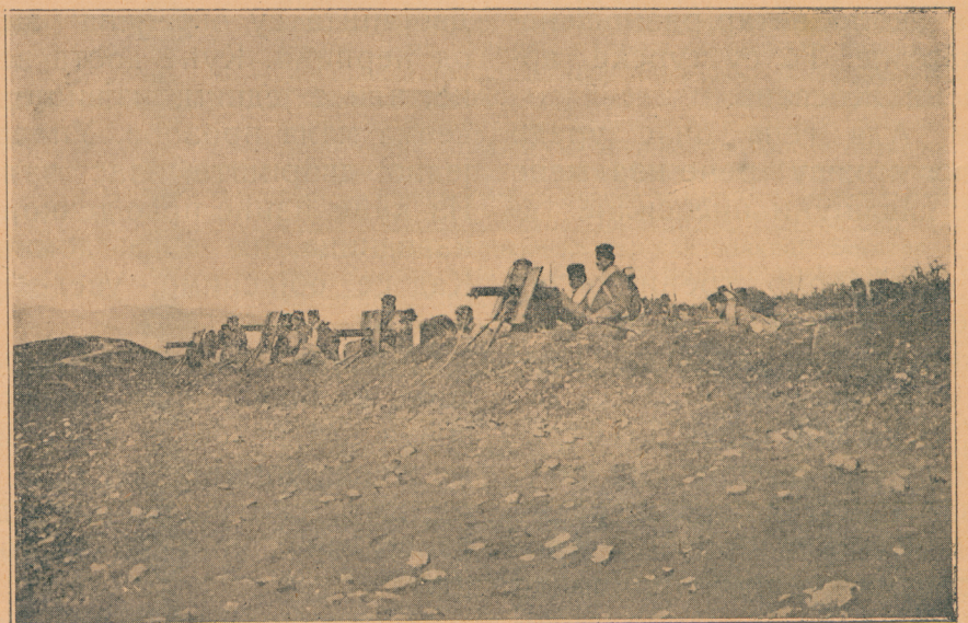
Српски митраљеци у боју на Подујеву