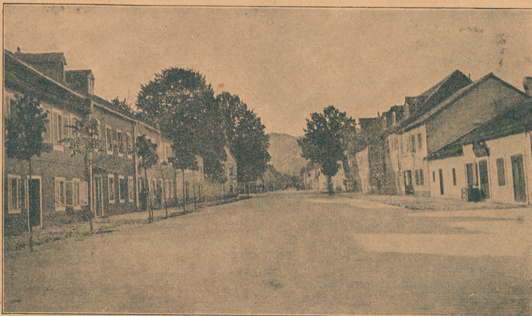
Главна улица на Цетињу

Куд год Марко земљу проходио, Ничему се није зачудио, Ни се Марко од шта застидио; Ту с' зачуди Марко и застиђе, Кад сагледа српског краља дворе. Од што беше по двору простирка? Беше чоха дворима до врата, А по чоси лијепа кадифа. Но како су у двору душеци! Каки ли су под главу јастуци! Све од сува злата исплетени. По дворима многи чивилуци, Где се веша господско оружје, Чивилуци од белог сребра, А јабуке од сухога злата. У дворима на лијеву страну Ту бијаше совра постављена, На соври је сваке госпоштине