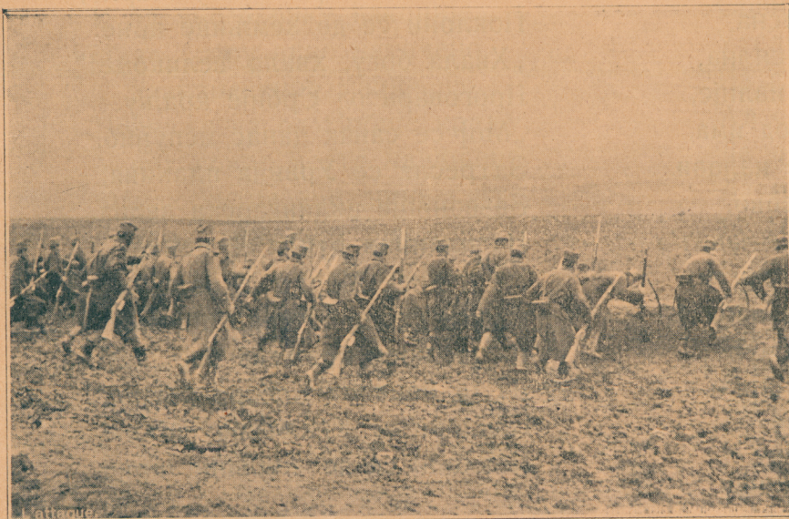
Јуриш српске војске на турске позиције

а други без ичега. Са тог једног ата скинемо оне сандуке, у које нисмо имали кад завиривати, (нисмо имали чиме да их на брзо разбијемо) па једног коња узјаше војвода а другог ја, и тако наставимо пут. Сад нисмо више нимало зазирали на овоме месту, јер да ту има кога, који би био опасан по нас, он не би оставио коње на сред пута.