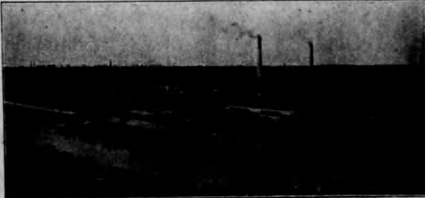
(稱改場工版大所作工組林大元) 場工社會式株藝工材木外內

東京市麴町區丸ノ内一丁目二番地 橫濱市中區相生町三丁目五十三番地 名古屋市中區廣小路通六丁目三番地 關東市東區公園町三十五番地 大連市南區大通二丁目一番地 京都市中區區堺町通御池下ル 神戶市神戶區海岸通十二番地 金澤市下堤町六十一番地 靜岡市傳馬町百三十七番地