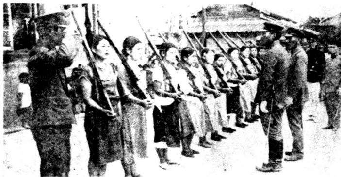
日輝村少女之軍事訓練

，共同作業，生氣勃勃。——福島縣。 (F) 自行車運動——佐波郡的實科高等女校盛行一種自行車體育化的