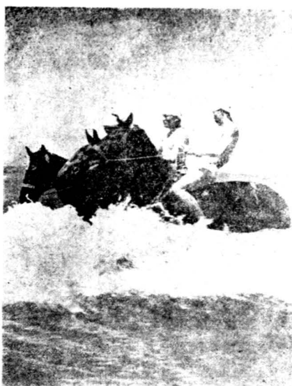
日本青年之河河演習

學的耐久競走，成爲日本長途競走運動的雙璧。限定時間爲二十四小時，走官道，並特劃獎章線，各生走過此線者賞以獎章。去年第十三回的成績，最高紀錄爲三十五日里（一里〇六，八華里）。全校平均徒步距離爲十七里半，而歸來後請假休息一日者只一人。——山梨縣。