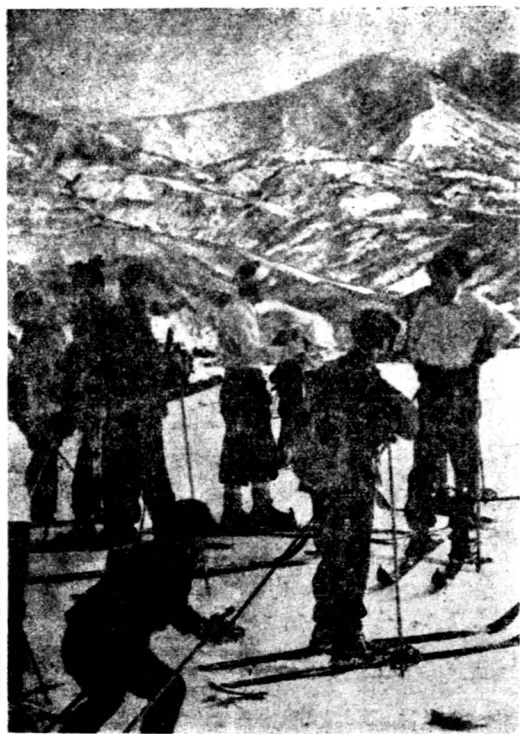
日本青年之滑雪遊戲

日本青年體育向上運動，可概分爲都會與縣市兩方來講，關於都會方面的，以前在本刊曾有過論述的文字，如體育設備的十分完善，棒球、水泳、摔跤之極爲普遍，每年有許多次得獎的比賽，以及各大中小學校學生的軍事訓練，新聞社主辦的各項體育賽會等，茲不贅述矣。僅以日本各縣市地方爲單位，撮要一述其青年體質向上運動的近情：