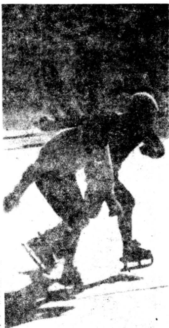
日本青年滑冰之比賽

現學生的體格極為惡化。更就統計局所發表的，日本近年的人口增加率減退，死亡率增加，幼兒死亡每年達四十萬，尤其是肺結核患者數每年有一百三十萬人，死亡者十三萬眾，可驚的數字，幾令人難信。