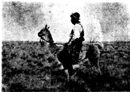
乘者行於廣漠中之阿人

水之別，種類極多，特殊的有蒸氣鴨，黑首白鳥及赤鶴等。班普湖一帶，也棲息多種動物。C. u. gaucha 是班普一帶的哺乳類動物，可比之于，美的普萊利犬，與穴居鳥及其他夜鳥，在地下空穴中