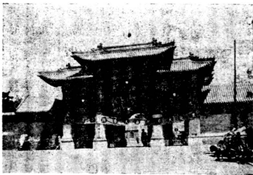
東大臨時校舍之大門