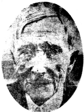
最近逝世之洛克斐勒

，他的煤油托辣斯是煤油業的前鋒，政治上的黑魔，大營業的仇敵和好壞托辣斯的模範。他的托辣斯是無形的，不分地域的，不易捉摸的；沒有什麼，也不製造什麼，在報紙上，也不宣傳什麼。然而，數十年以來，它却統治了煤油世界，鐵路世界，大部的銀行界，政治世界和新聞世界。他比較現任美國大總統羅斯福還要偉大，因為羅斯福的權力只