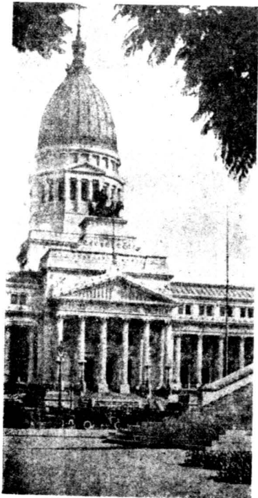
阿根廷國會之國會廳

阿根廷全境，一般地說是氣候溫和的，只有北方一小部分入于熱帶，年平均等溫線是北二十度以上，南達五度。至于安迪斯高地及最南部是常見冰雪。