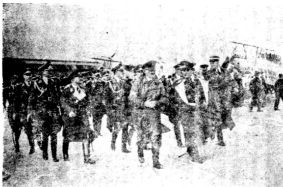
由飛機場外出之國社黨要人

道，遂能直接抓住最敏感的地點去壓迫英法。顯然的，法西斯蒂的外交，在干涉西班牙內戰中，並不僅僅是要發動一個恢復殖民地的鬥爭而已；其另一直接目的就是欲抓住機會壓迫英國，以逼迫英國放縱地向東歐及東南歐，自由伸手。