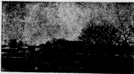
□ 新秋時光的後湖風景 □