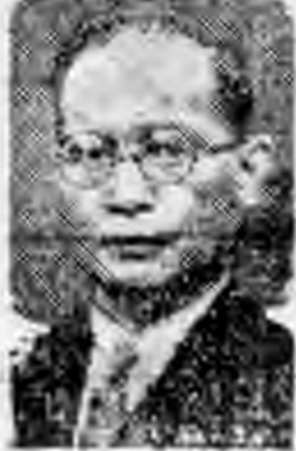
▲日蘇戰事中外交談轉之人物：上爲蘇聯外交人民委員長李維諾夫近影，下爲蘇聯駐蘇大使張高峯之近影。