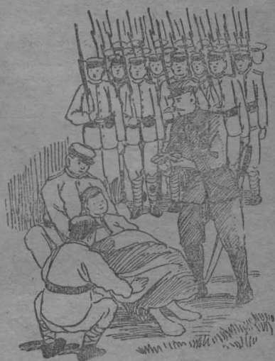
收拾小孩子的屍體。