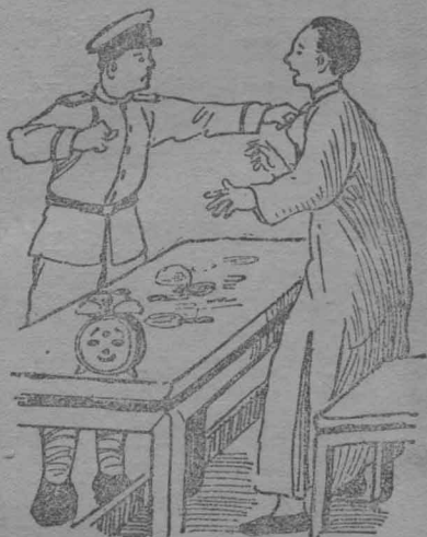
兵士要打 祝松 。