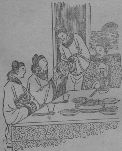
皇帝送大臣一件玉器。

可是，單獨對於他，格外地優待，而且，還說了許多溫和的言語，慰勞他的辛勤。那大臣很恭敬地聽着，心中十分感激；等到酒筵將完的時候，國王又吩咐侍從們，拿出一件很尊貴的玉器送給他；那時，凡是在座的大臣們，誰也都羨慕他的幸運；因為，這件玉器，實在是不可多得的寶貝。