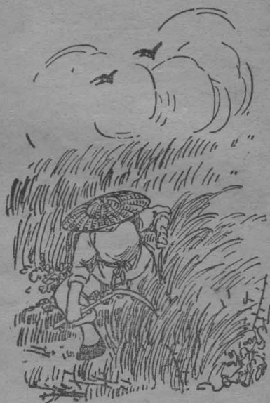
割去荊棘，預備下種。