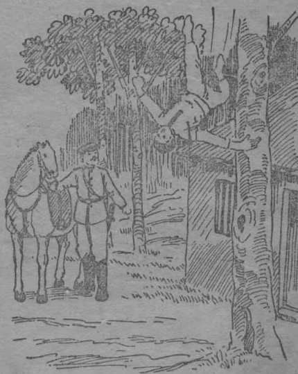
小孩子中彈跌下來了。