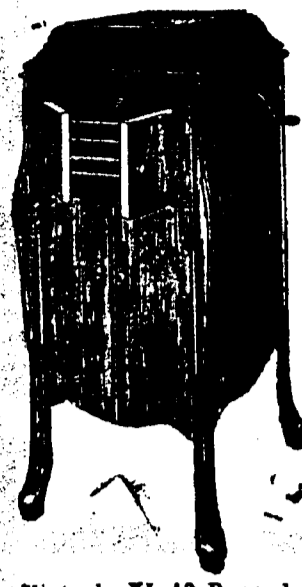
Victrola XI, 12 Records, Prix $109. Conditions—Un quart comptant, le solde en six paiements mensuels égaux.