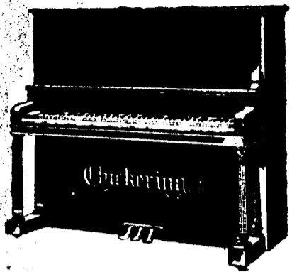
4 pieds 2 pouces droit, $500 comptant. Conditions—$12 par mois, 6 pour cent arajout. 4 pieds 6 pouces droit, $550 comptant. Conditions—$12.50 par mois, 6 pour cent arajout.