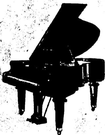
5 pieds Grand, $675 comptant. 5 pieds 7 pouces Grand, $725 comptant. 6 pieds 5 pouces Grand, $800 comptant. Conditions—$25 par mois, 6 pour cent arajout.