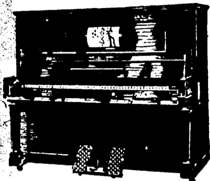
STEINWAY PIANOLA PIANOS, $1,250. Conditions—$50 par mois, 6 pour cent arajout.