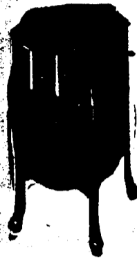
Victrola X, 10 Records, Prix $82.50. Conditions—Un quart comptant, le solde en six paiements mensuels égaux.