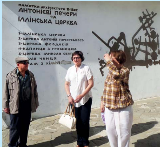
Зліва: Посол Арабської Республіки Єгипет Усама Тауфік Юсеф Бадр