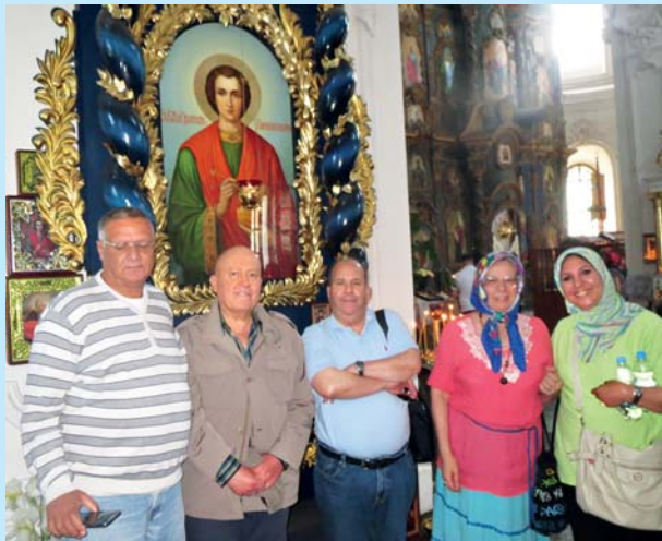
Посол Арабської Республіки Єгипет Усама Тауфік Юсеф Бадр, Посол Алжирської Народної Демократичної Республіки Хосін Буссуара зі співробітниками посольства Єгипту та Франції у соборі Різдва Богородиці у м. Козелець