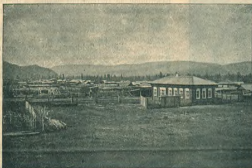
Рис. 1. Верхне-Усинское.