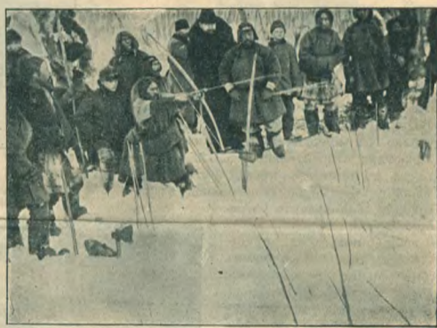
Медвѣжий праздникъ (рис. 3).

продолжается празднество, которое разнообразяется бѣгами, состязаніемъ и музыкальн. звуковъ, получаемыхъ при ударахъ палочками о подвѣшанное сухое бревенцо.