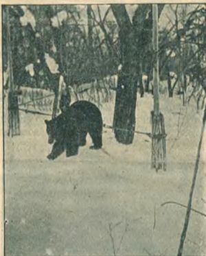
Медвѣжий „праздникъ“ (рис. 1). (Изъ коллекціи д-ра Волкенштейна).

По южную сторону отъ селенія Верхне-Усинскаго раскинулась ровная степь, кое-гдѣ съ остатками пней лиственницы, загороженная съ юга отрогами послѣдняго погранич-