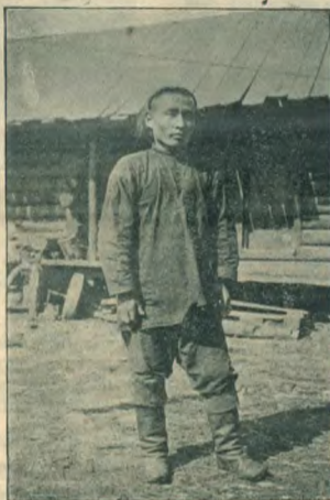
Рис. 3. Сойотъ-работникъ.

Источники существованія населенія довольно разнообразны. Хлѣбопашествомъ занимается почти все, распахивая сообразно рабочей силѣ хозяйства отъ 1—20 десятинъ; по земледію здѣсь не можетъ считаться обезпечивающимъ существованіе, потому что ранніе заморозки часто губятъ еще не созрѣвшіе хлѣба. И это