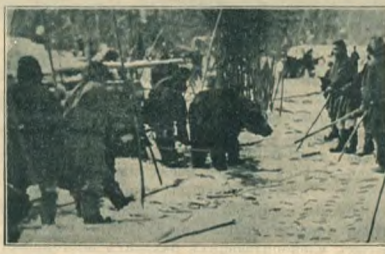
Медвѣжий праздникъ (рис. 2).

личныя, выручаемыя отъ продажи продуктовъ своихъ исконныхъ занятій. Кроме того, у гиляковъ не выработалась привычка къ питанію картофелемъ. Саранка, черемша, дикій лукъ, ягоды, находимыя въ изобиліи и заготавливаемые впрокъ, вполнѣ пока замѣняютъ наши огородныя сборы.