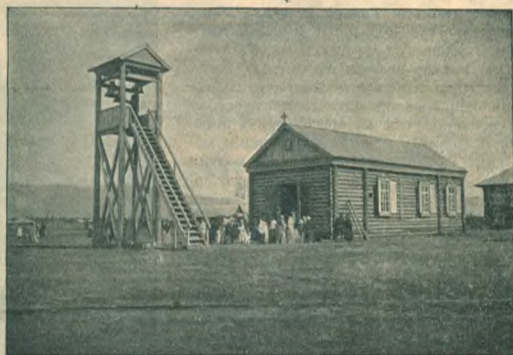
Рис. 2. Молитвенный домъ въ В.-Усинскомъ.

населенными здѣсь были только раскольники, а міряне присоединились впоследствии. Объ этомъ говоритъ, какъ названіе рѣчки Мирской , такъ и выраженіе, принятое здѣсь,—„ѣхать въ міръ или прѣхали изъ міру“, т. е. изъ Минусинскаго уѣзда или вообще изъ населенной, „мирской“ части Сибиря.