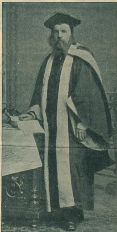
Д. И. Менделѣевъ.

ной и развитіе просвѣщенія и связанныхъ съ нимъ добродѣтелей. Вотъ если отрицать эту связь, вотъ если вѣрять, что рай сзади, а не впереди, вотъ если забывать плачь отцовъ, матерей и семей, когда гибнутъ люди въ прежніе періоды жизни государствъ, что видно изъ доказаннаго въ статьѣ о народонаселеніи малаго прироста людей въ прежніе періоды исторіи, наконецъ, вотъ когда не вѣрять въ связь между просвѣщеніемъ и удаченіемъ человечества— вотъ тогда можно проповѣдовать благо нищенства, не по той логикѣ, что дождя не идетъ, если зонтикъ въ углу, а по той, которая показываетъ дѣйствительное удаченіе правды и всей государственной жизни по мѣрѣ развитія просвѣщенія».