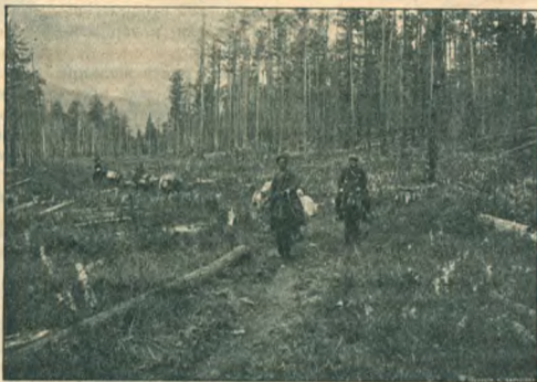
Нижняя долина р. Мирской.

несмотря на то, что Усинское лежитъ всего на высотѣ около 600 метровъ надъ уровнемъ моря,—тогда какъ въ Уймонской степи, поднимающейся до 1000 метровъ и въ селеніи Берельскомъ, лежатъ выше 1200 метровъ надъ уровнемъ моря, хлѣбопашество идетъ довольно успешно, и хлѣбъ примерзаетъ рѣдко. Такъ сказывается сравнительная широта мѣстности, а можетъ быть и болѣе восточное положеніе.