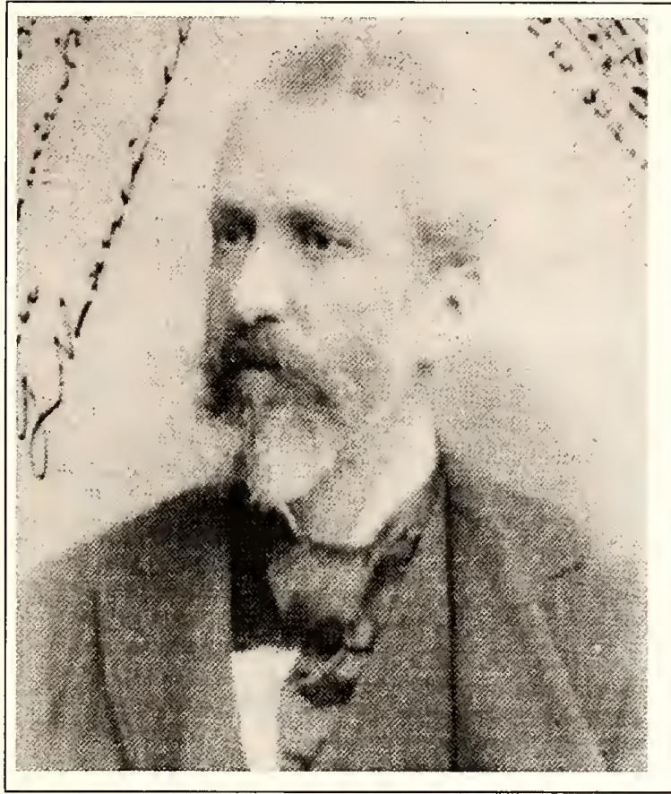
Luigi Mancinelli (1902)