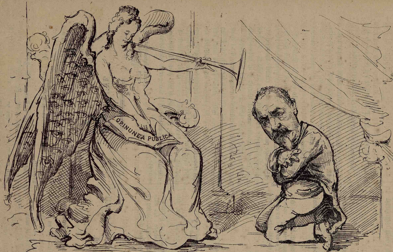
— Ertare, ertare, Stăpina mea. — Să te erte DAMELE de salon; eu sunt «nă femeă de uliță», nu potū nimicū.