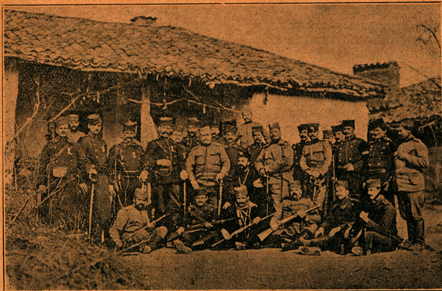
Српски официри и војници који су први одликовани под Једреном од бугарског краља

И заклетва краља бугарскога, На грудима часно знаменије, Краљ бугарски што га погазио. Мирно краљу стаде пред Асана, Очи вјерне к небу обраћаше, Јеванђељем груди заклањаше. Мрко Асан на краља погледа, Хтједе крвник њему прилећети, Ал му нешто коракнут не даје Ни с татари краља опкољети. Тако краљу мало постојао, Пак Асану громко проговара: „Татарине кад ми скинеш главу Однеси је мом невјерном шуру И од мене поздравље му кажи: Од Бога је вјера и братимство, Од сотоне проклето невјерство! И још реци краљу вјеролому, Кад му земан до пред Бога дође, Нек понесе ово Јеванђеље, На коме се вјером заклињао!“ То изусти краљу Владимире Једном крочи међ Татаре дође, Ја да видиш Асан војеводу, Он намакну крвава целата; Диге целат сабљу оковану, Паде глава у зелену траву, Њој прискочи Асан војевода, Крваву је диге са земљице, Пак је баци коњу у зобнице, Однесе је краљу бугарскоме. Боже драги и славо ришћанска, Кад Бугарин главу угледао Грохотом се на њу насмијао; Десном руком главу дохватише, На софру је мртву поставио, Пак овако њојзи проговара: „Здраво да си од Србије главо, Ходи главо, да се причестимо И братинску вјеру ухватимо!“