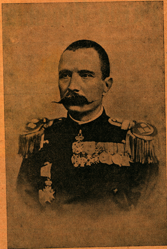
Генерал Петар Бојовић, началник штаба 1. армије

Што му ваздан по пучини језде Ка бијели по небу облаци. Има Србин на мору галије, А у мору рибе шестокриле, Па кад сунце у море замине, А звијезде небом прогледају, Шестокрилке лећу изнад мора, Извију се кано препелице, Сву ноћ поју кано ластавице. А кад с мора кроз приморје пођеш, Зелене се брда и долине, По брдима кестен и маслина, По долини смоква и неранца. А што горе иду под облаке, Све притисла стада свилоруна, Два пут овца јагњи у годину, Више стада но на гори листа! И то бих му, опростио, слуго, Ал не могу никад до вијека, Што Владимир блиста у свијету, Ђегод идем све о њему збори! Што је Грка и Србаља што је И сувише Арбанаса љutih, Све то пјева краља Владимира, А о мени нигдје ни помена, Ђегод има земље сиритиже Све то њега пјева, благосиља. Залуд мени силе и господства, Залуд мени копља и јунаштва, Својега сам брата погубио Те преузех царску Бугарију, И српске сам земље прегасио, Многе српске круне расковао,