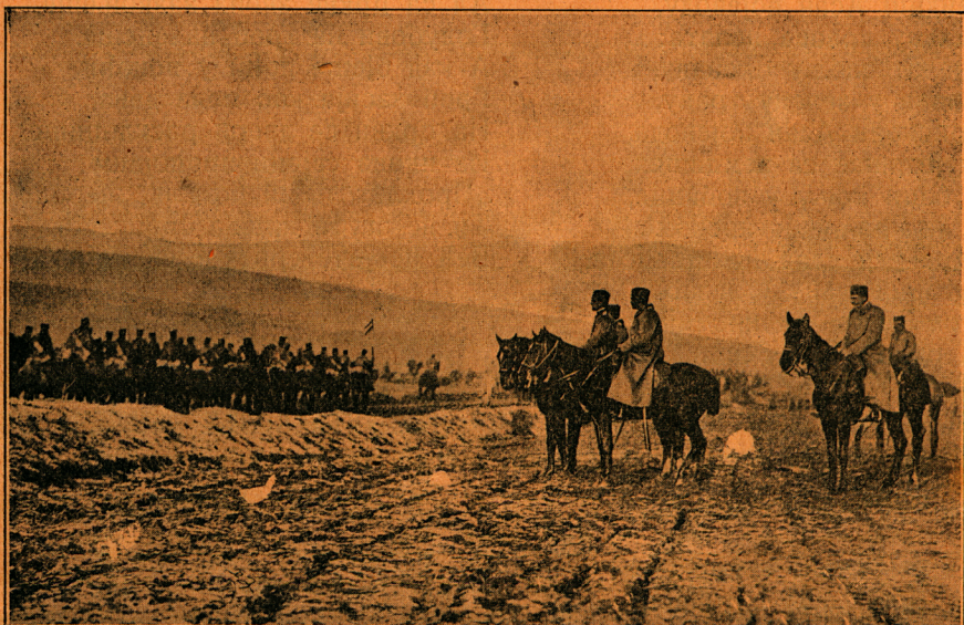
Престолонаследник Александар са својим штабом после битке код Битоља

Ал да видиш краља бугарскога Кад Владимир светом храму дође! Колико се крвник срадовао, Од софре је скоком устануо И гостима живо покликнуо: „Благо мени јутрос до вијека, Ђе надмудрих краља Владимира! Србин луду донио је главу, Јутрос ћу је узет са рамена!“ Краљ покликну Асана привикну, Дуже Асан двадесет Татара И сувише краљева џелата, Пак полеће цркви крај језера. Истом Асан цркви допануо А краљ стаде цркви на вратима; У руци му свето Јеванђеље,