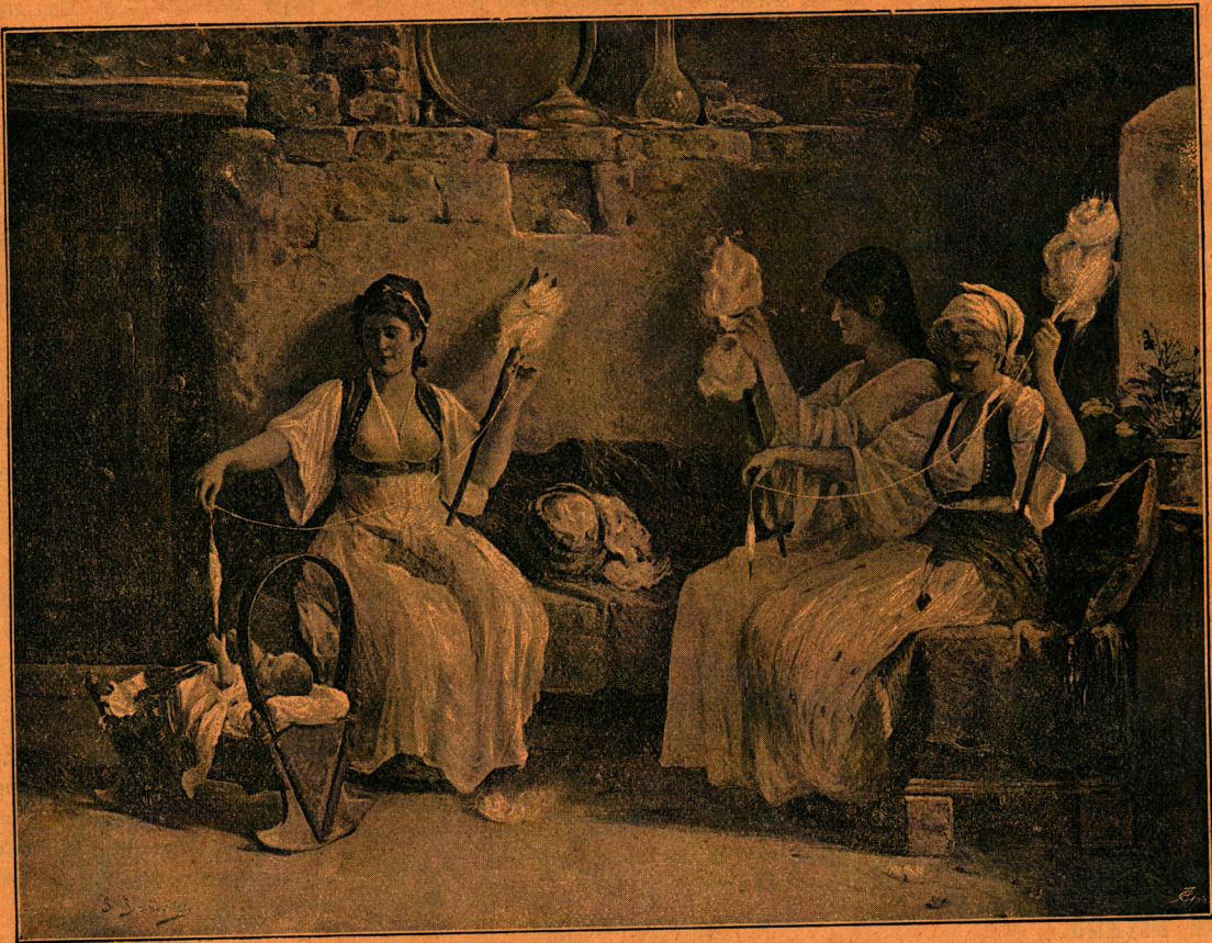
Црногорке на дому: Преље

Отровно семе јевропских зала, Несрећну децу охоло цара, Природан савез људскога квара: Черкеза, Курда, зејбек, Татара Са грозном бруком, са алкураном, Крвавом руком и јагаганом, Јуре по дану, траже по мраку Девојке бедне, децу нејаку; И са ханџара бели се глава. Или се пара дели крвава Нејаког чеда, ил старца седа, Или је, можда, главица бледа Невести лепој с рамена пала На хладно гвожђе оштрога реза Дивљега беса: Татара, Черкеза! ... Прешли су земљу Бугарског стења, За њима земља остаде сама, На земљи гробље, по гробљу тама, У тами ужас опустошења, Гаравог стења, крви, камења, Али за цара нема карара; У мору крви нема пехара, Његовој жеђи ту није гаса, Још њему није доста ужаса, Видло је око охолог назови цара, Још једну земљу преко Балкана, Што је слобода љуби, целива, А дичан народ крвљу умива: „Тамо, витези, Курди, Татари, Из мрачне крви српскога мора Татару зора синути мора?..“ И напред дера хиљаду чета, Крвљу да пере ругобу света, Ругобу своју и свога народа; Ал стоји војска српскога краља, Синови храбри српских земаља,