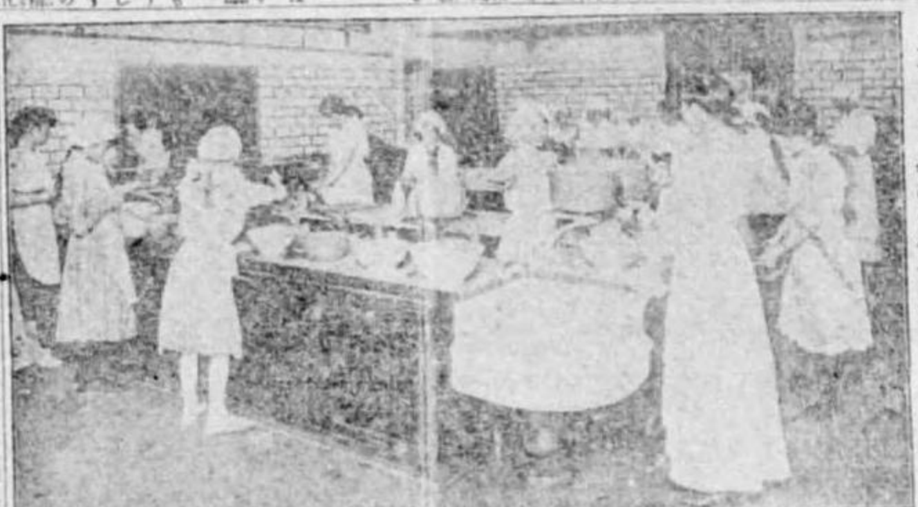
エマソン學校の料理教室

海軍の要求する 國民教育の改善 一海軍士官 華府會議の要諦 世界には、海軍の改良は、 國民教育の改善に資する爲め 音楽趣味の鼓吹 △音楽の普及 △民衆的音楽 △獨逸の實例 △軍備制限 △國民教育の改善