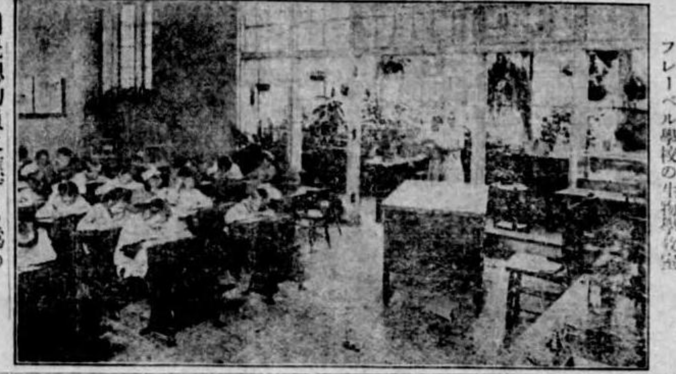
フレール學校の生物教室