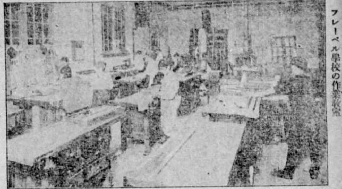
フレブル學校の作務

教育改善に資する爲め 音楽趣味の鼓吹 △音楽の普及 △民衆的音楽 △獨逸の實例 △軍備制限 △國民教育の改善