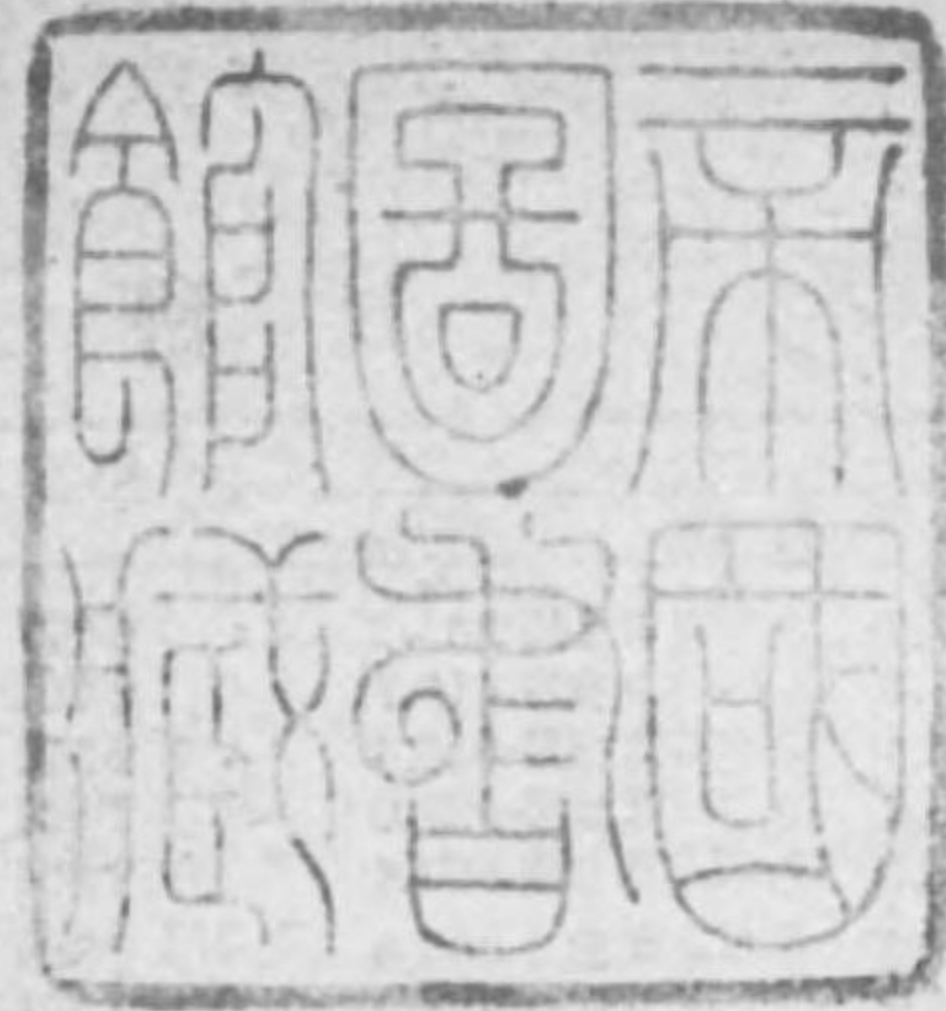
表 計 統