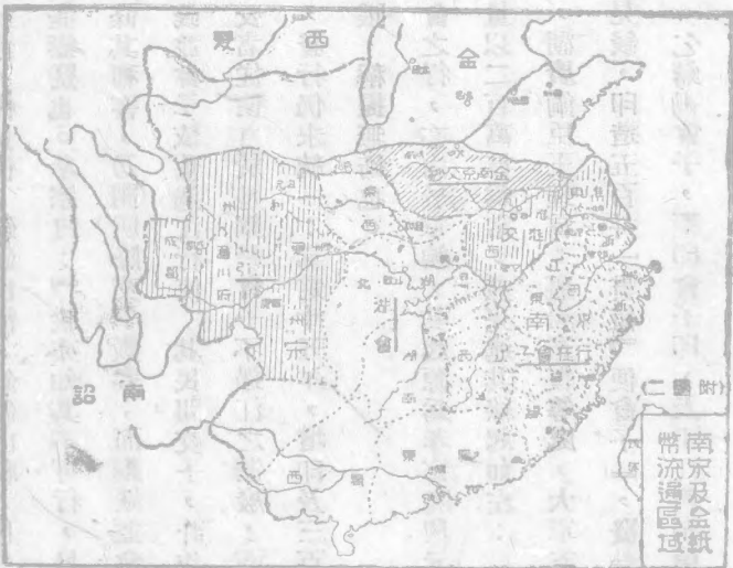
南宋及金紙幣流通區域