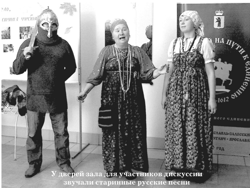
У дверей зала для участников дискуссии звучали старинные русские песни