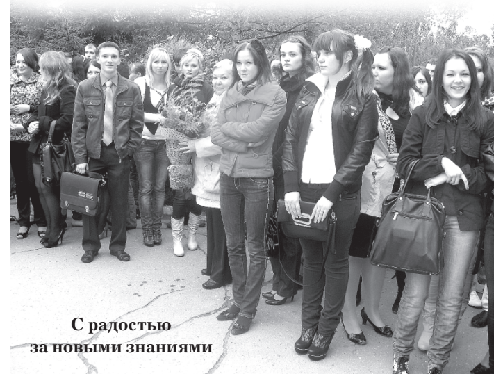
С радостью за новыми знаниями

Для справки можно сказать, что в этом учебном году колледж принял 195 бюджетников, примерно столько же, сколько и в прошлом. Вокруг какой-то определенной специальности ажиотажа поступающих не наблюдалось - хватает и экономистов, и юристов, и программистов... Ну и напоследок хочется всем студентам пожелать крепких зубов, чтобы удачно грызть гранит науки.