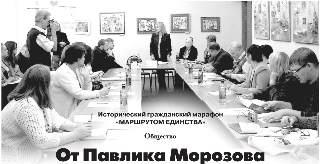
Исторический гражданский марафон «МАРШРУТОМ ЕДИНСТВА»