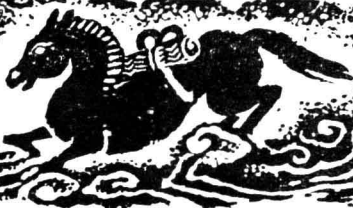
表 經 傳