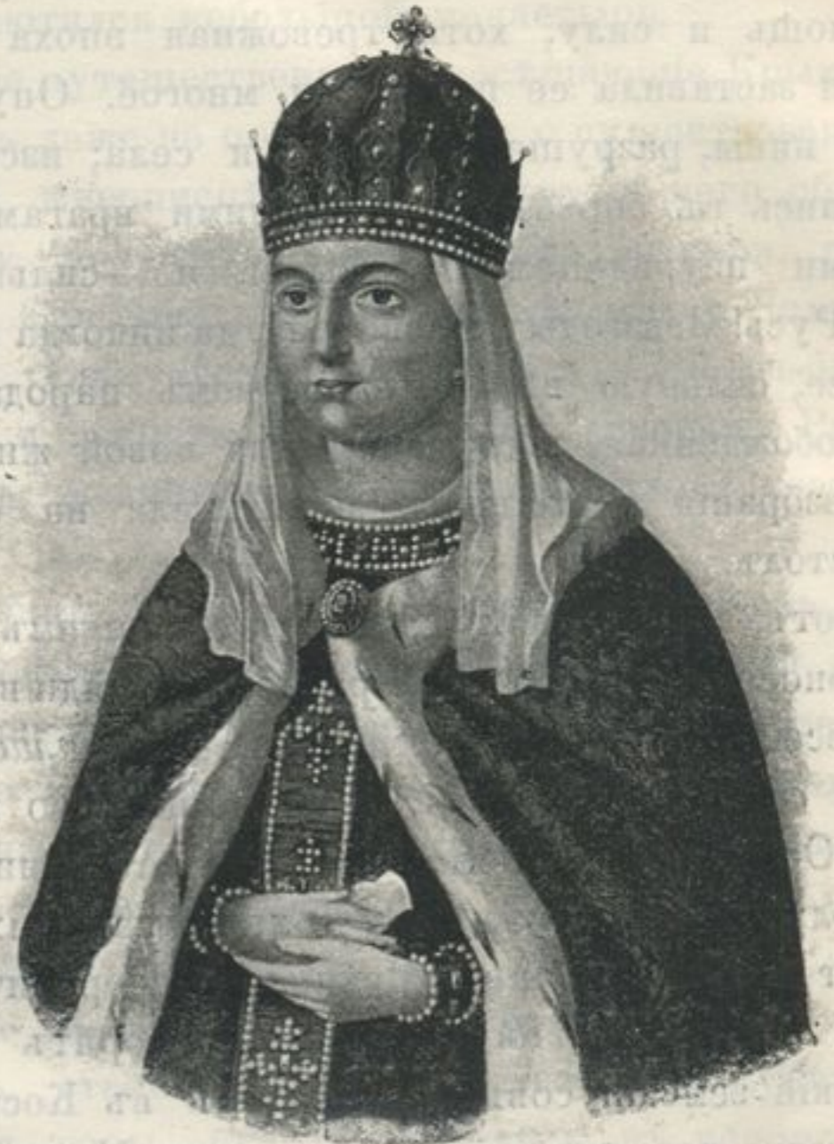
Царица Евдокія Лукьяновна.