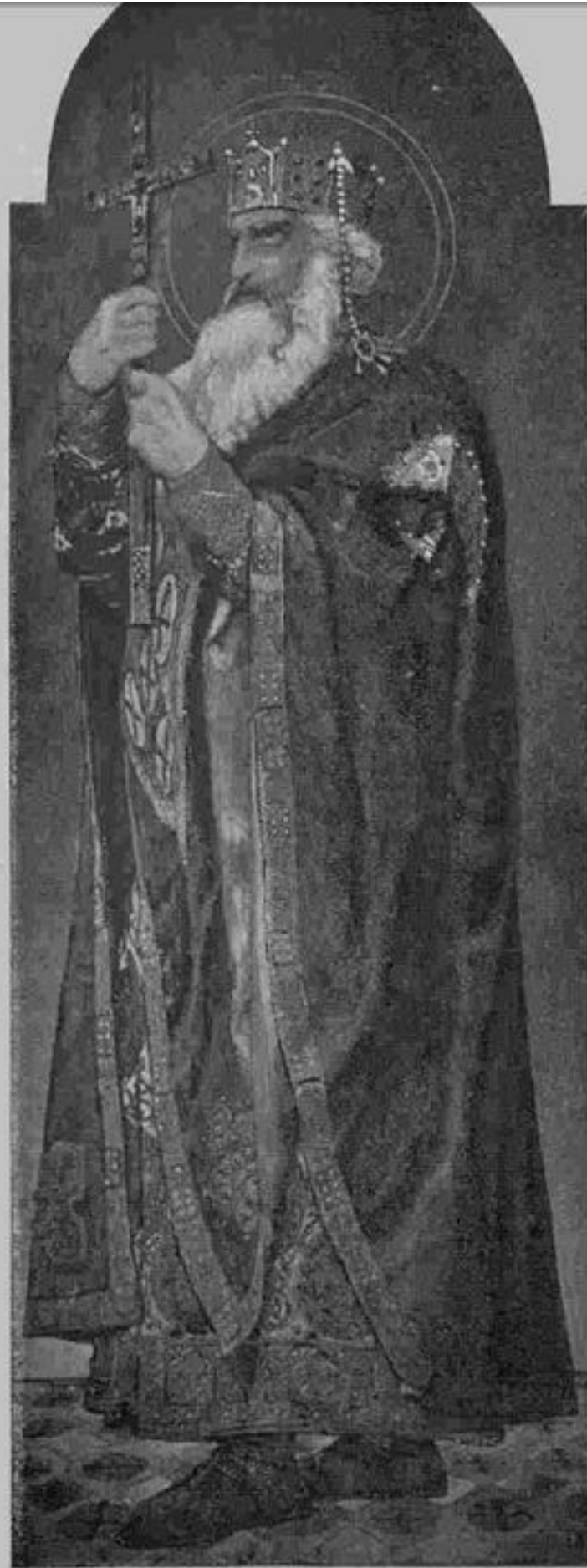
Св. кн. Владиміръ.

Съ фотографій Л. Г. Краевскаго въ Києві. Авторъ іконъ Эд. Голице.