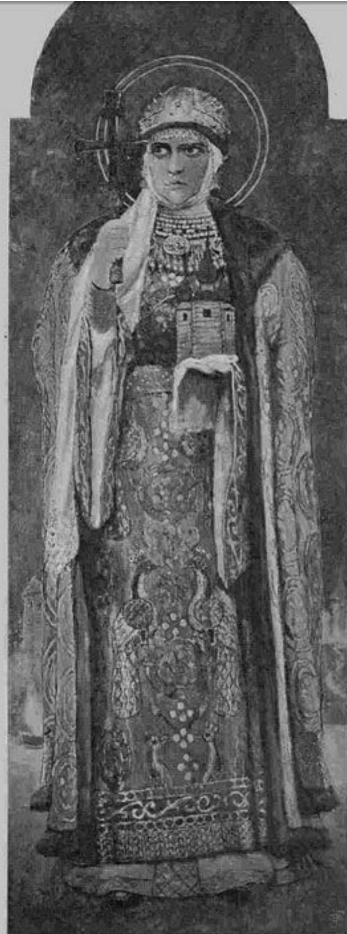
Св. княгиня Ольга.

Съ фотографій Л. Г. Краевскаго въ Києві. Авторъ іконъ Эд. Голице.