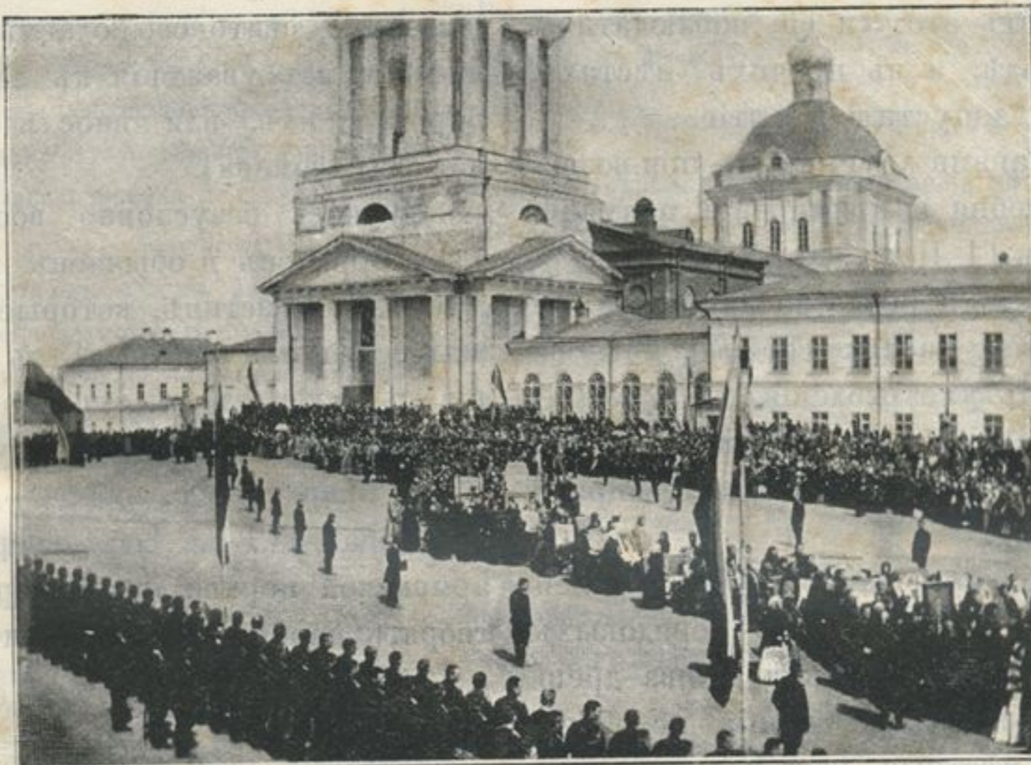
Выходъ крестнаго хода изъ соборнаго храма.

сандрапальской (пасхальное посланіе Теофила александрийскаго), иерусалимской (18-е огласительное слово Кирилла иерусалимскаго), равно римской и другихъ западныхъ (Левъ VI, Григорій II-й) четырехдесятиница, вмѣстѣ съ страстной седмицей, состояла лишь изъ шести недѣль; въ первыхъ двухъ церквахъ въ 7 в. была прибавлена еще одна недѣля, а въ послѣднихъ, по распоряженію Григорія Великаго, 4 дня (съ среды седьмой недѣли предпасхальной—это carut jejunii).