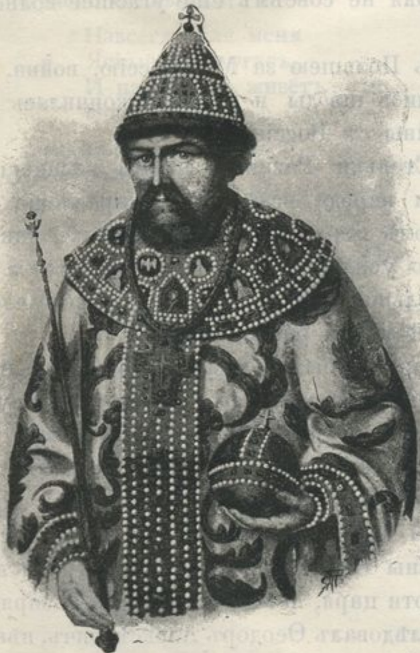
Царь Алексѣй Михайловичъ.