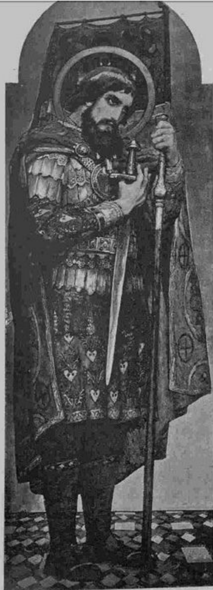
Св. кн. Александръ Невскій.