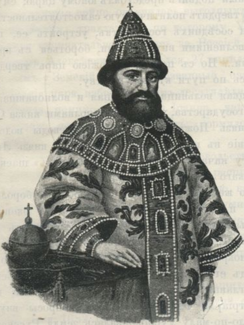
Царь Михаилъ Феодоровичъ.