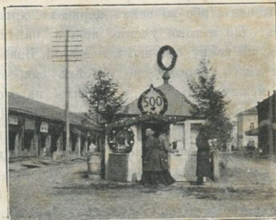
Прибытіе въ часовню.

Касательно числа браковъ для мірянъ—восточная церковь считала повторительные браки предосудительными и съ разными ограниченіями (епитиміи); допускала только три брака (Оригенъ, 1-е прав. собора