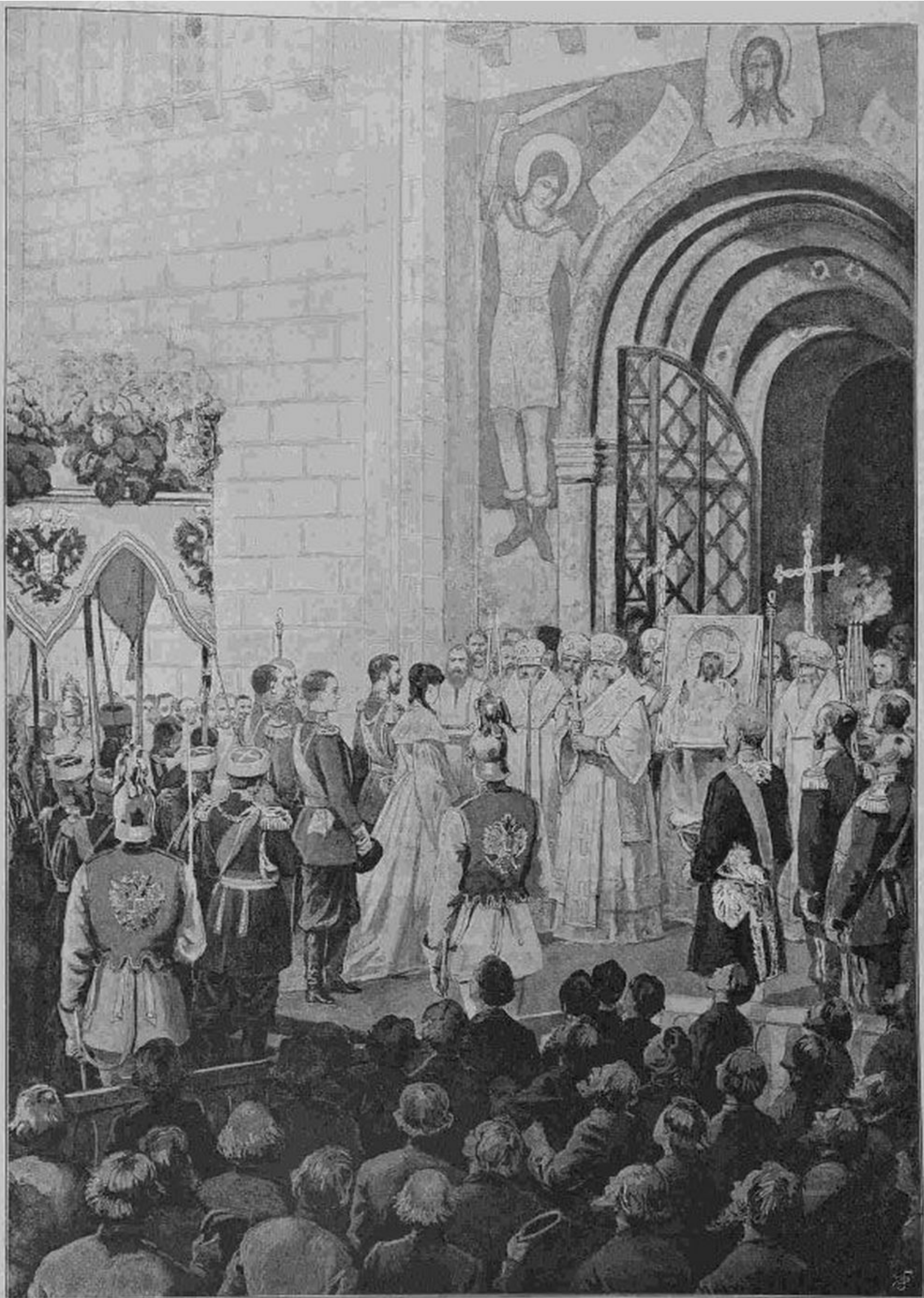
Священное Коронованіе Ихъ Императорскихъ Величествъ. — Встрѣча у входа въ Успенскій соборъ

Рисунокъ съ натуры А. А. Чижина. Автолінія Э. Л. Голца.