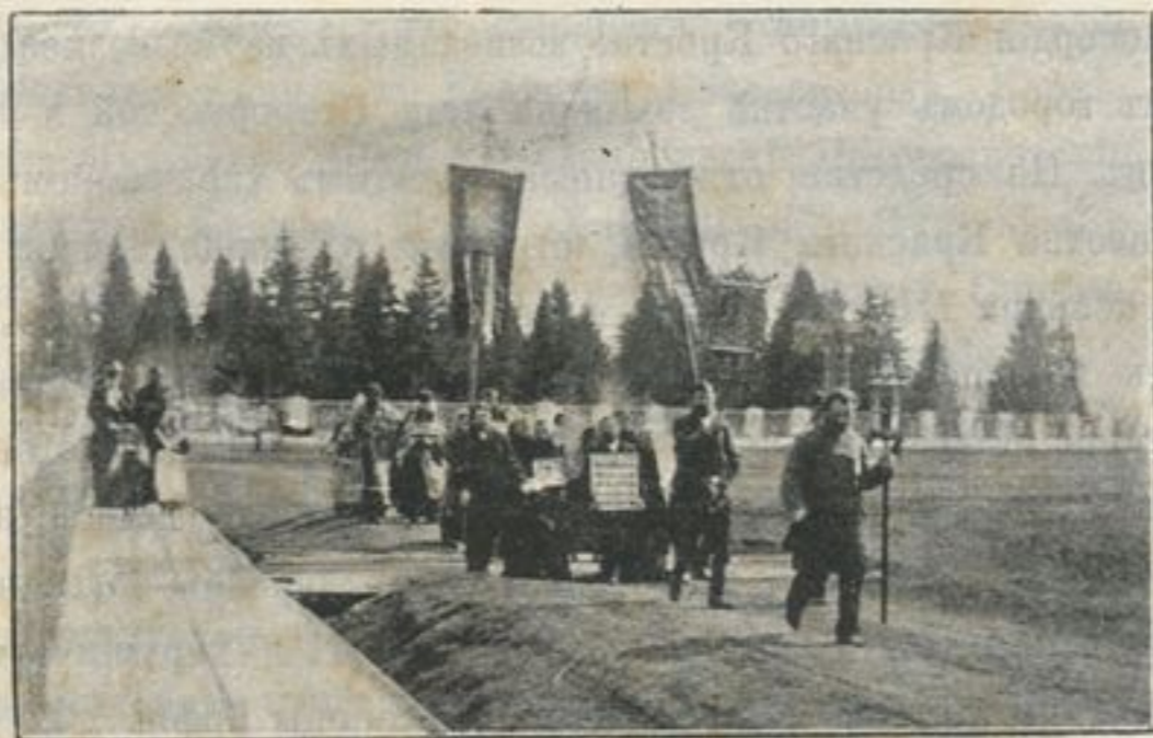
Шествіе къ часовнѣ.

сандрапальской (пасхальное посланіе Теофила александрийскаго), иерусалимской (18-е огласительное слово Кирилла иерусалимскаго), равно римской и другихъ западныхъ (Левъ VI, Григорій II-й) четырехдесятиница, вмѣстѣ съ страстной седмицей, состояла лишь изъ шести недѣль; въ первыхъ двухъ церквахъ въ 7 в. была прибавлена еще одна недѣля, а въ послѣднихъ, по распоряженію Григорія Великаго, 4 дня (съ среды седьмой недѣли предпасхальной—это carut jejunii).