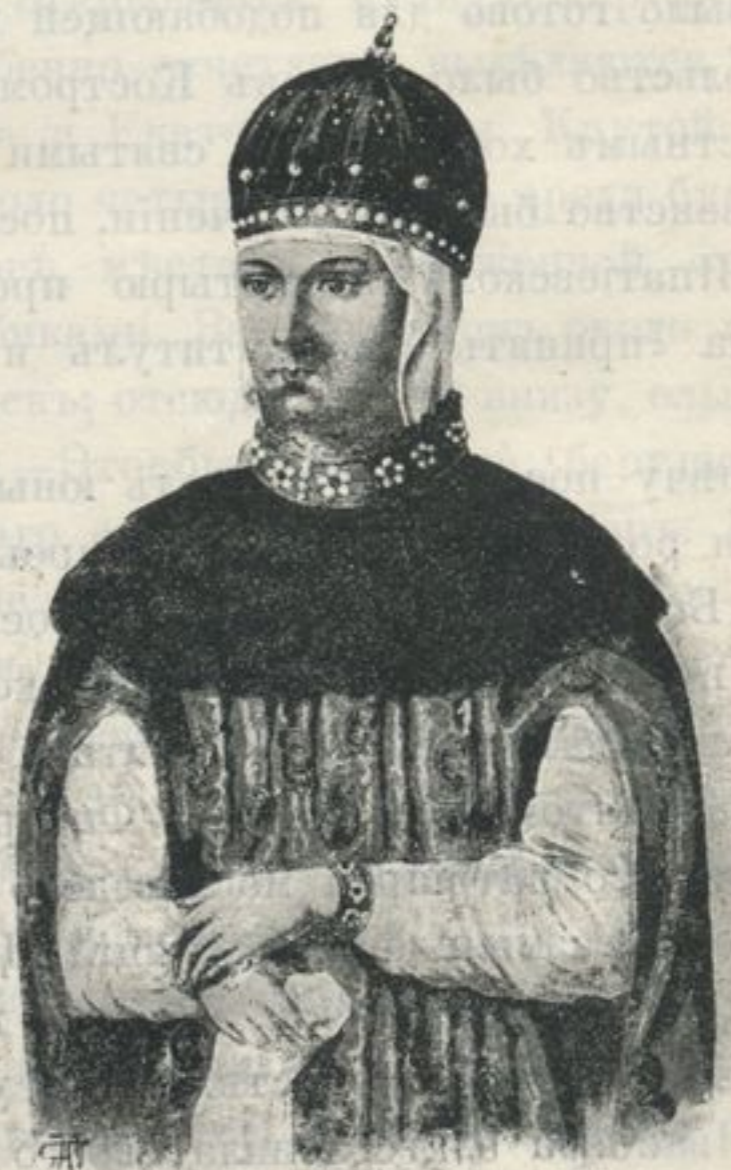
Царица Марѣя Ильинична.