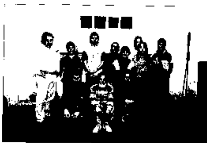
Taldeko partalde batzuk