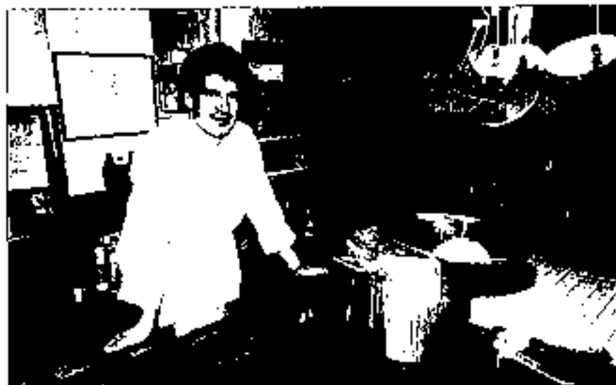
Karlos bazkariak prestatzen

K.I.: Hain zuzen ere, ostatur berria ireki da. Hain zuzen ere, ostatur berria ireki da. Hain zuzen ere, ostatur berria ireki da. Hain zuzen ere, ostatur berria ireki da.