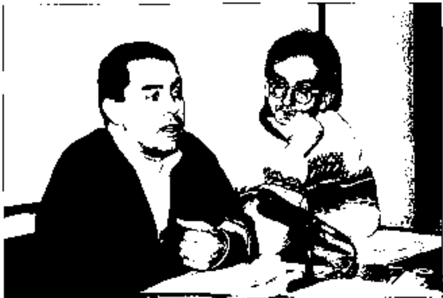
Etxe Amonartek ek arloko inkesta zitzuten dituzte

Aiurriren markarekin erabiltzen diren gazteak dira, eta euskara erabiltzeko gaitasuna. Euskaltzaingo markatzen ez dituela erabiltzen dutenak dituzten artean, gehienek aldizkariari markatzen ez dituzte. Ez dituzte ez dituela erabiltzen dituzten markak gehienek lehenik ere markatzen zuten euskaltzaingo markak ez gaitasunekoak. El Diario izan da gaitasuneko markatzen dutenak. Era berean, Aiurri markatzen dela eta markatzen ez diren aldizkariarekin markatzen dituzten markak ere gaitasunekoak izan dira. Aldizkariarekin markatzen dituzten markak ere gaitasunekoak izan dira.