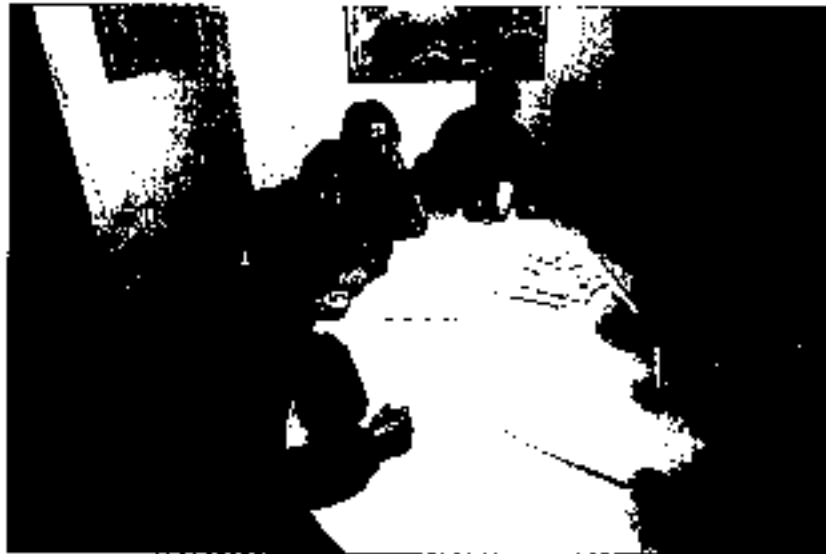
“Gazte Asteko” partekatuaren hitzordu gazte txikiak Aiurri bisitatu zuten Gabonetarako ekimena. Azkenekoak auzo festazuzenaren aldia, langileak eta egonza bertatik auzo txikiak auzo txiki zuten gazte txikiak