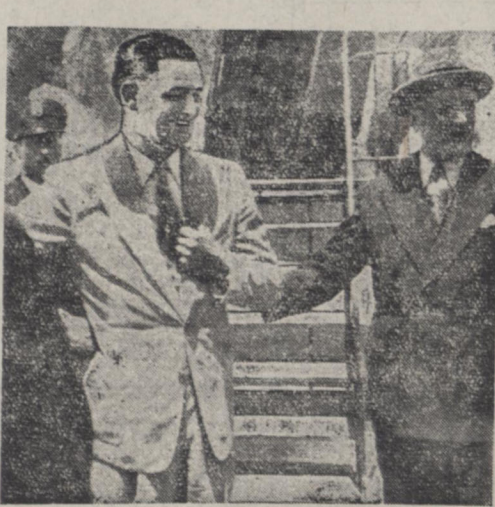
آقایان هندرسن سفیر آمریکا و «وادر» رئیس اداره اصل چهارم هنگام ورود بفرودگاه مهر آباد

آقای هندرسن سفیر آمریکا در ایران ساعت ۱۰ و پنجاه و دو دقیقه بامداد امروز با آقای وادر رئیس اداره اصل چهارم با هواپیمایی وابسته نظامی سفارت آمریکا در تهران از کراچی وارد تهران شد. در فرودگاه مهر آباد جمعی از کارمندان عالی رتبه سفارت آمریکا حضور یافته بودند و بازگشت ویرا به هندان خیر مقدم گفتند. آقای هندرسن در فرودگاه از هر گونه اظهار نظر درباره مذاکراتی که طرف پنج روز توقف در کراچی طی ملاقات خویش با آقای دالس وزیر خارجه آمریکا در کراچی بعمل آورده در صحنه چهارم