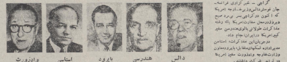
دالی هندرسن بایرو استاسن و ادزورث

دربارتهای که دیروز دالی در شهر کراچی منتشر ساخت رسماً اعلام نمود که : دولت امریکا آمپوز است در آینده بهر دوباره مسائل جاری خاور میانه تقاضات نماید