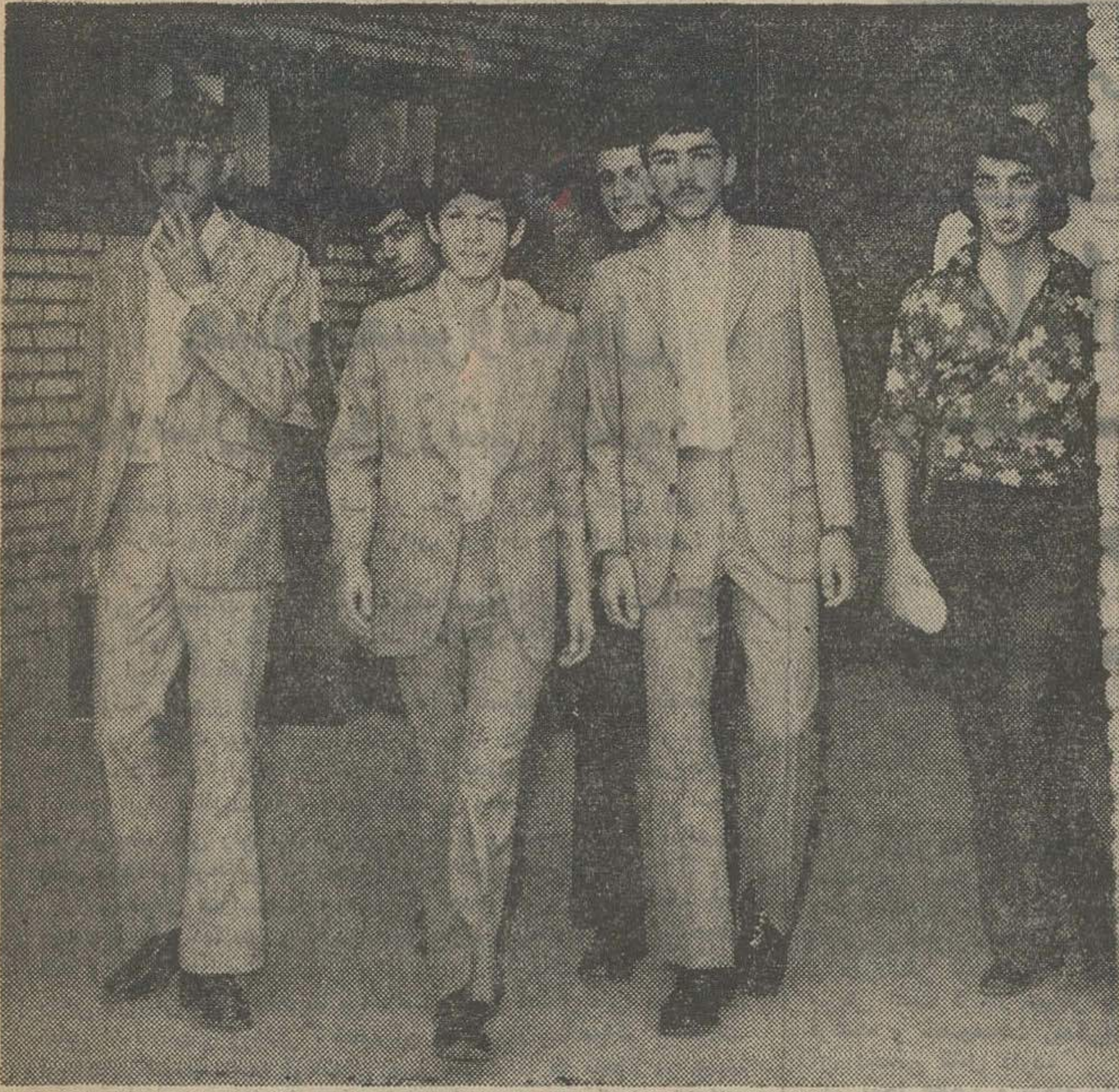
* پسران این جوانان، بهنگام تحصیل، مجبور بودند لباس‌های متحدالشکل، از پارچه‌های یک فرم و یک رنگ کازرونی بپوشند. ولی حالا، اینها، هیچ قیدی برای لباس پوشیدن ندارند و تنهاترین هورتنگ و هورتنگ و هورتنگ لباسی را می‌پوشند، بلکه گاه بابلوز و کاپشن هم بپوشند!

دبیرستان آرم: در حد زانو! دبیرستان رضاشاه کبیر: فقط ه سانتی متر بالای زانو!