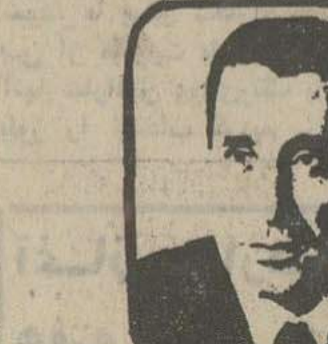
در شماره آینده: چه بودیم و چه شدیم

خوشبختانه عوامل پیشرفت مقاصد دیگران هستند. عدلی جریان دارد که جوانان مملکت را هرجا بتوانند گیر بیاورند، در ایران یا خارج از کشور تحت تاثیر تبلیغات قرار دهند و آنان را از حقیقت و واقعیت دور سازند و در نتیجه شاید بدون اینکه بعضی جوانان عزیز ما متوجه شوند خدای نخواستگ وسیله پیشبرد امیال و مقاصد دیگران قرار گیرند.