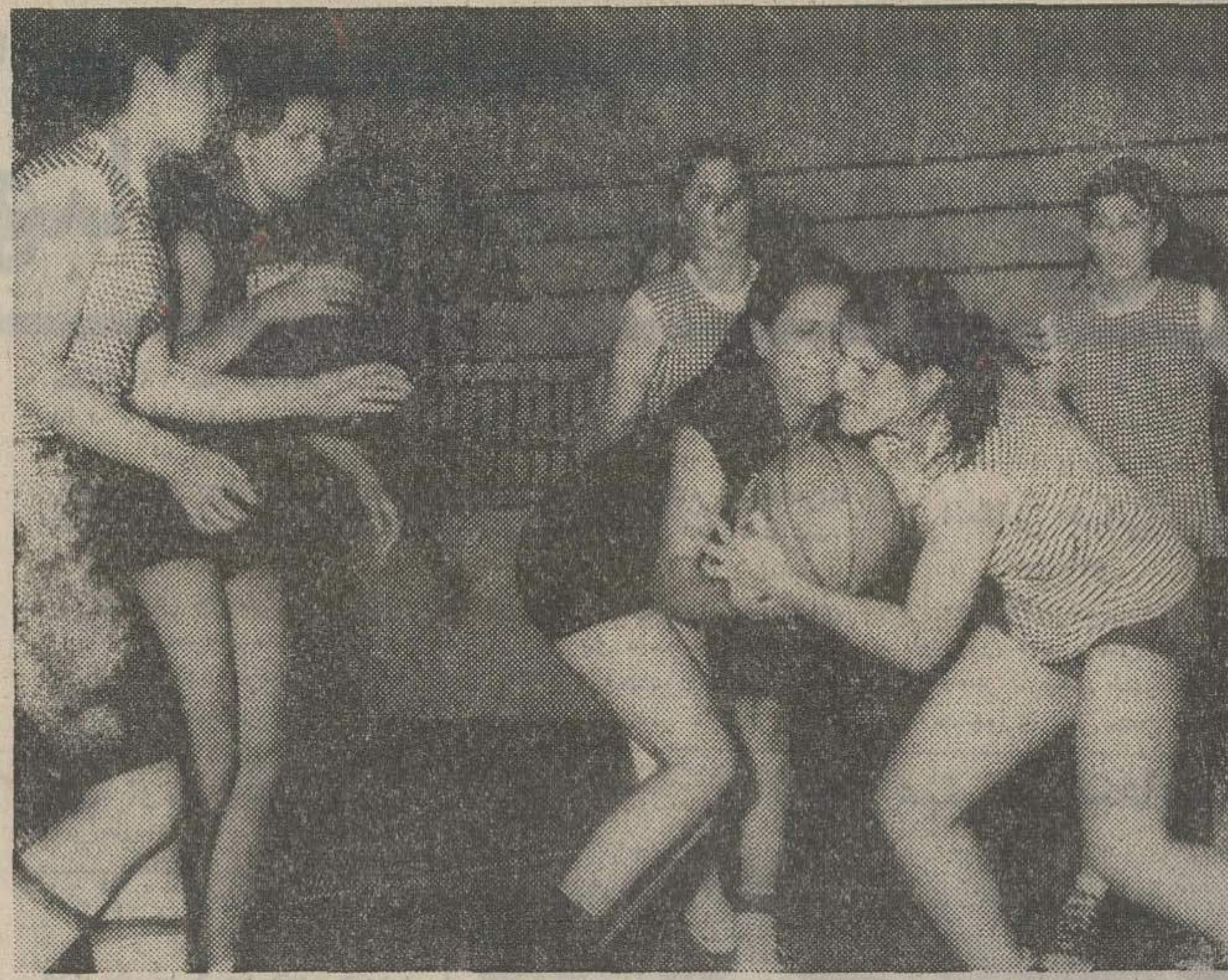
بازیکان برتیره آزمایش در مسابقه دیروز با تیم بسکتبال برق آتجان که شایسته بود درخششی نداشته. این مسابقه که در پایان شکست تیم برق را به همراه آورد ، یکی از مسابقات جالب و تماشایی بود که بازیکنان جوان برق توانستند در مقابل حریف نیرومند و بر تجربه خود آزمایش بخوبی بدرخشند.

چهارده تیمی که به دور بعدی این مسابقات راه یافته اند عبارتند از: گروه ۱ شوروی ۲۲ امتیاز دانمارک ۲۰ امتیاز گروه ۲ یوگسلاوی ۲۲ امتیاز