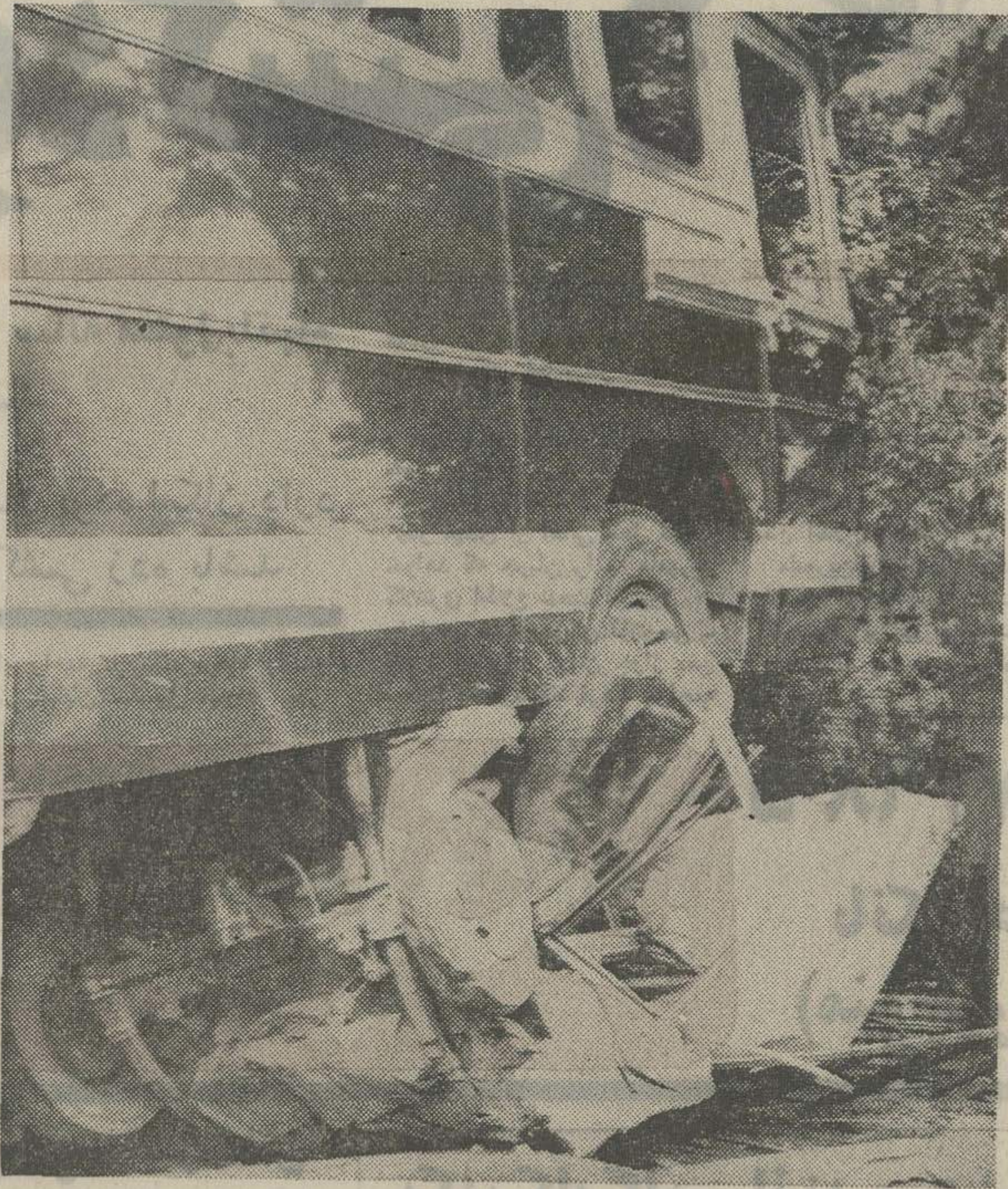
این عکس ، صحنه ای از حادثه خونی رانندگی تاکسی است. تاکسی را زیر گرفت و منتهای آن را به دریا انداختند. این حادثه ساعت ۲ پانزده دقیقه در روز چهارم راه «نقاشی» اصفهان روی داد و راننده تاکسی و ۴ مسافر آن کشته شدند.