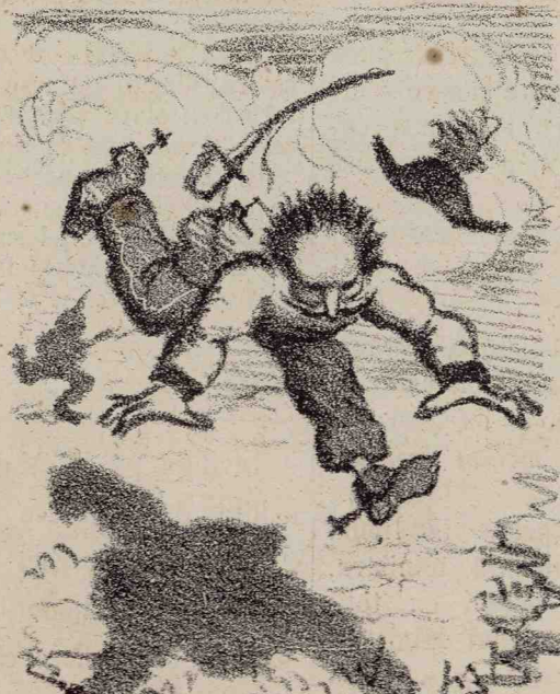
Benedek (Feld-marsalü) la Königsgratz în Boemia, la 1866.