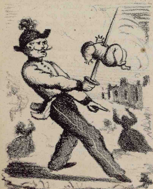
Benedek (Colonel) la Gdowo în Polonia, la 1846.

„Împărțit-ău hainele mele loruși, și pentru cămașia mea aș aruncatū sorti.”