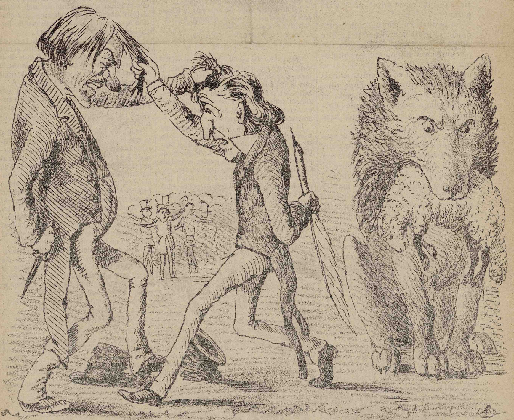
Inpăcăciunea și unirea partitelor.