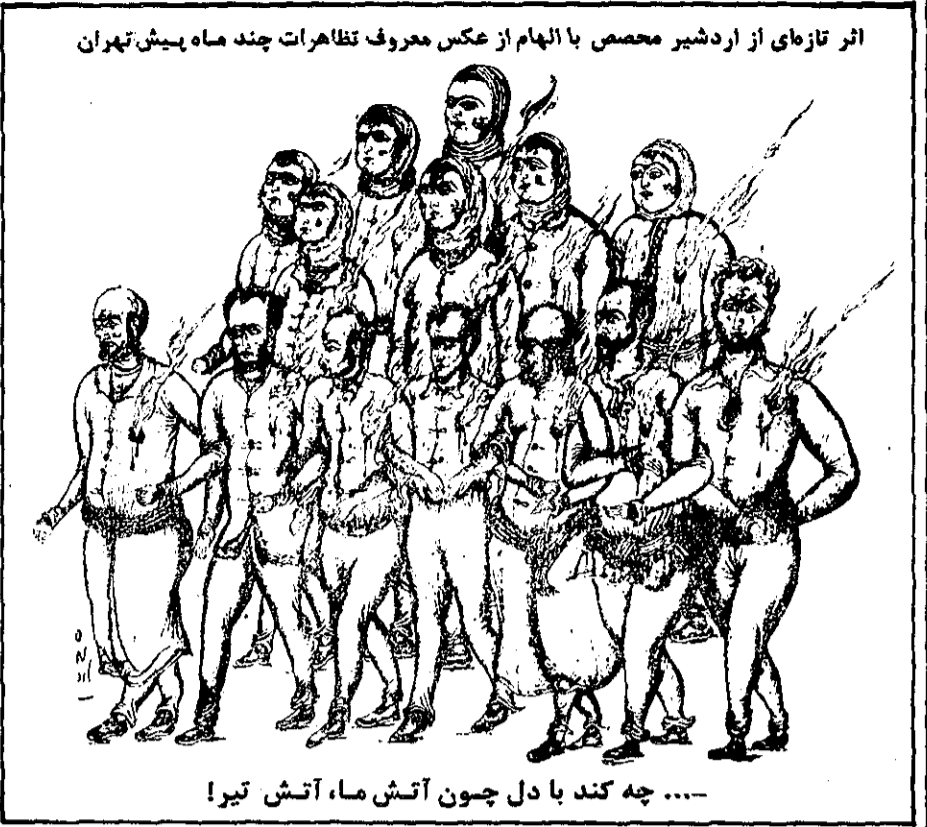
اثر تازهای از اردشیر محمسی با الهام از عکس معروف تظاهرات چند ماه پیش تهران