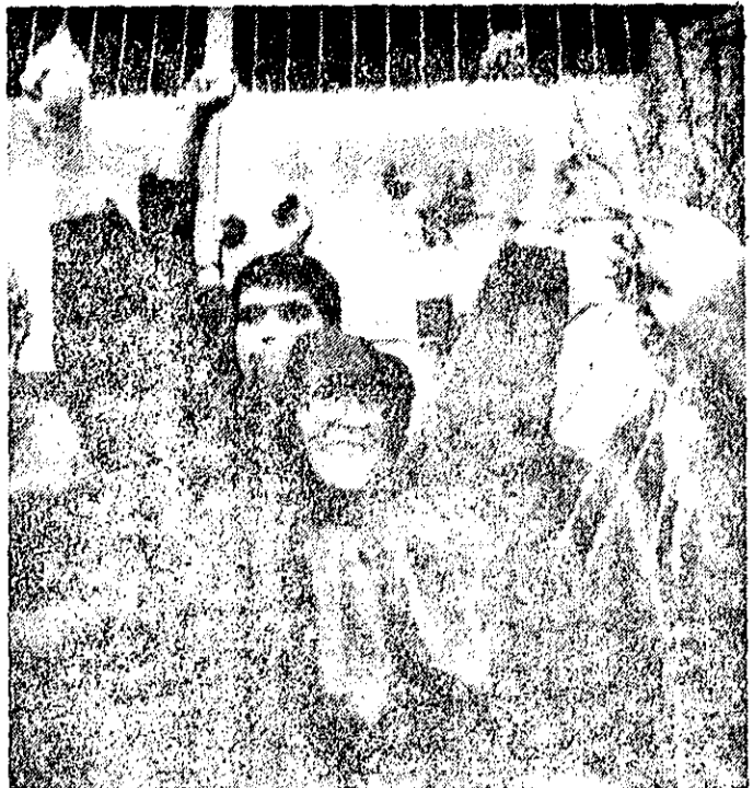
بنک زندانی سیاسی آزاد شده از خروج از زندان قصر برادرش در آشوب کشیده است.

به منظور همکاری و انطباق مردم برای تهیه و توزیع مواد سوختی و همچنین برای به وجود آوردن همگامی و همکاری برای آسان کردن برخی مایحتاج روزمره و همچنین برای همکاری جوانان و اهالی محل تشکیل گردیده که انجمن‌های قبلی تصور را بپذیرد کرده‌اند. تهیه نفت و گاز و برقی در محله‌های اطراف یکی از مشکلات عمده است که مردم است و در بیشتر نقاط و محلات تهران مردم برای تهیه نفت و گاز و برقی با مشکلات فراوانی مواجه هستند. این کمیته‌ها علاوه بر این مشکلات، اکثر کمیته‌ها کمیته‌ها را نیز تشکیل داده‌اند. این کمیته‌ها علاوه بر این وظایف، تمام برطرفی را که در کوچه‌ها و جلوی منازل آنها مشاهده شود، جمع‌آوری نمودند و محتوی آن را به کلی برقی‌فک کردند. از دیگر وظایف این جوانان و دیگر اعضای این کمیته‌ها، رساندن نفت به در محله‌های اهالی ساکن خیابان‌های اطراف و فرستادن مرع، تعمیر معابر و برقی و روشن به نرخ ارز است.