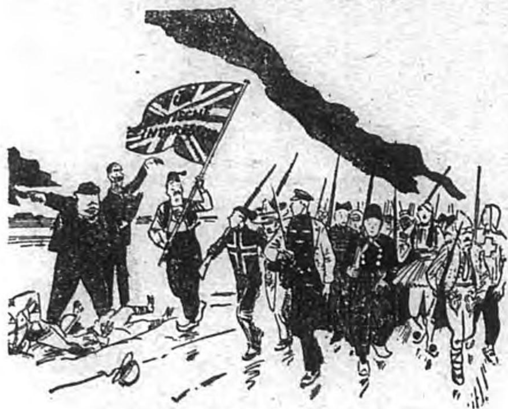
りたしかどをりたて編

この話が暗示することがある。それは強國間には生まれた弱小中立國の運命といふこと、逆にいふと凡そこの様な弱小中立國を間に挟んだ戦争の微妙な戦機といふことだ。四月九日から十日にかけてたゞとヨーロッパの各地から日本の新聞へ齎らされた電報の中にノルウェーが對英宣戦するだらうといふ電報が混つてゐる。當時これは「些か變だが、あり得ない話ではない」と考へられた。こと程左様に中立國の動向——といふより「動かされ方」は分らないのである。