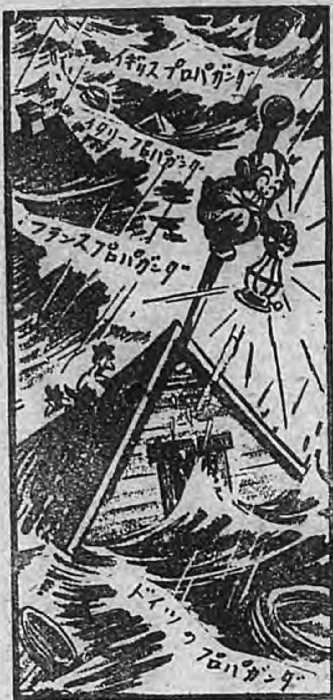
？たつ行へことは『實事』

「英佛側はフランス降伏直前まで、自國の勝利を信じてゐたのではないが、イタリアが一週間前に参戦しようが、一日前に参戦しようが、そんなことは勝利を信する英佛側にとつて、問題ではなかつた筈だ。イタリアが歐洲を覆へさんとする嵐を避けるため、人類のなし得る凡ゆることをなし、