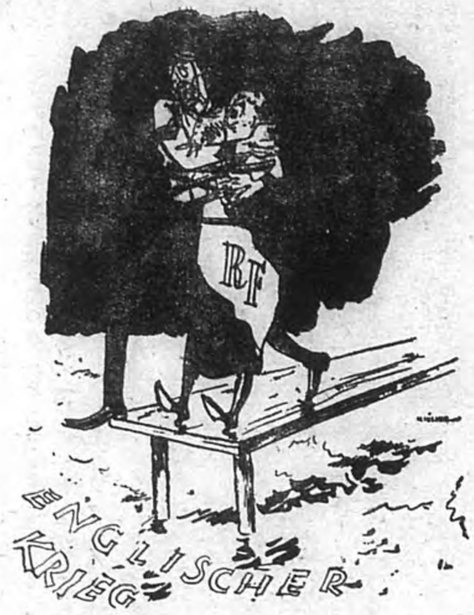
お前とばらまでも……………ドブ