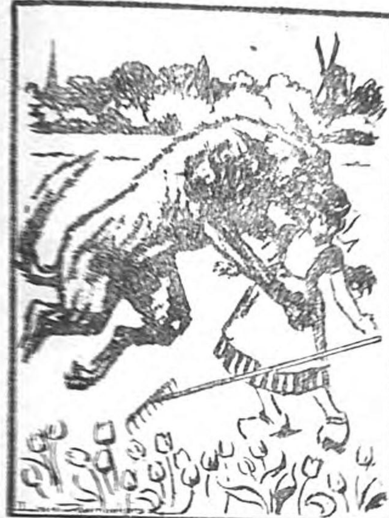
先づ事實の十條にもなつて聯合國と、この他の世界へ放送されたといつても誇張ではないだらう。

以上が、オランダを占領して使 つて使用された。ペニーニ ト部隊の威力の運用であるが 當時このバラシュエルト部隊の 活躍の様に備へられたかき 地點に、確實にドイツ軍の手 に歸した。