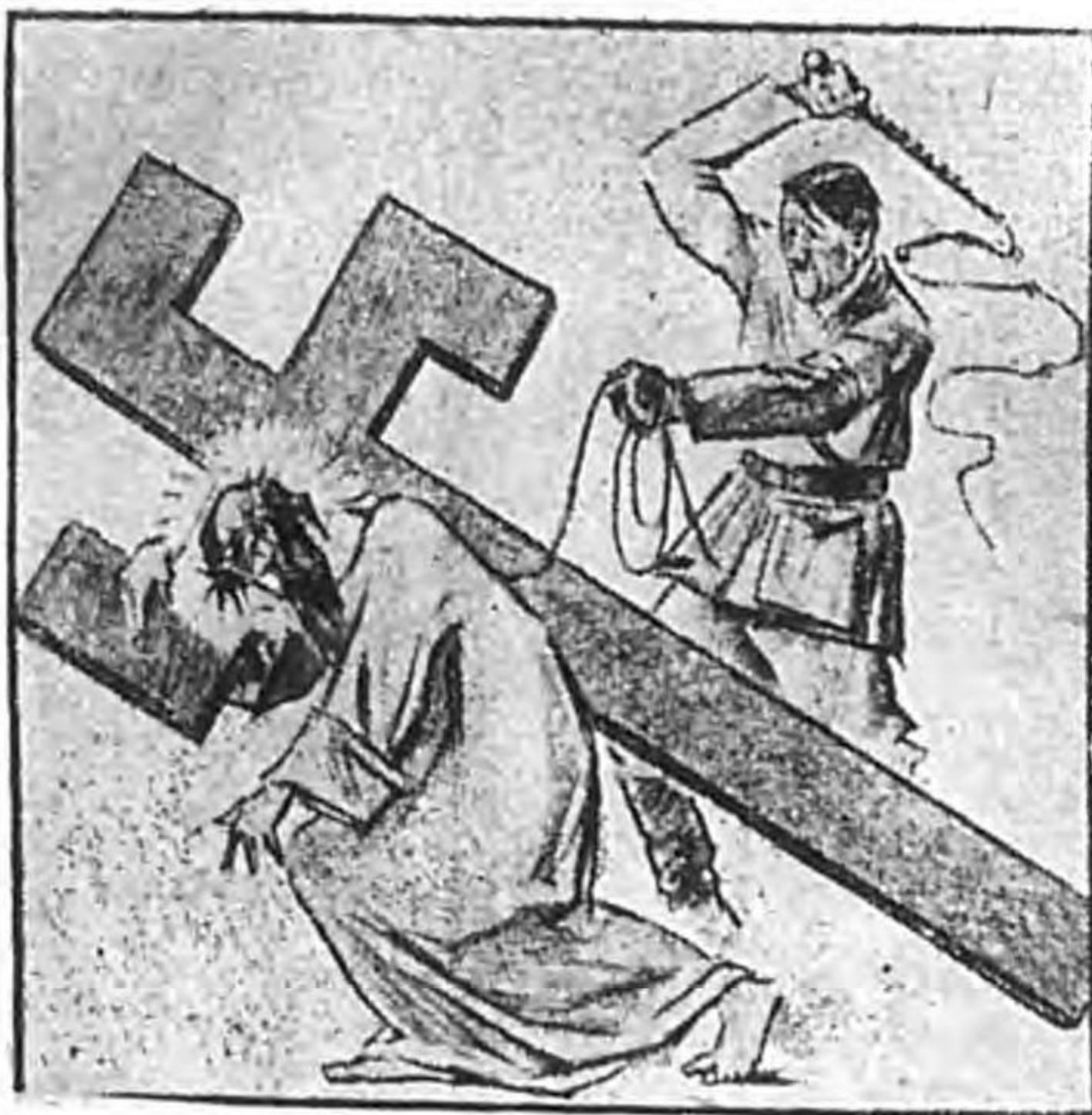
(だんるれ入を人ンアリアてつ拂道を様貴)

聯合國側のやり口はこれに比べて甚だ手緩い。戦局誘導に就いては、相變らずバルカン危しの一木槍で、英國政府は英船舶に地中海航行禁止命令を出して見たり(四月三十日)、ロンドン外交團から東南歐危しを放送させたり(五月二日)したが、一向ドイツが乗つて来ない。アメリカを主目標にした民主主義的第三國への宣傳も、局面誘導のための確たる手がかりがないので、だん／＼馬鹿げた人道主義宣傳に墮落してしまつた。曰く