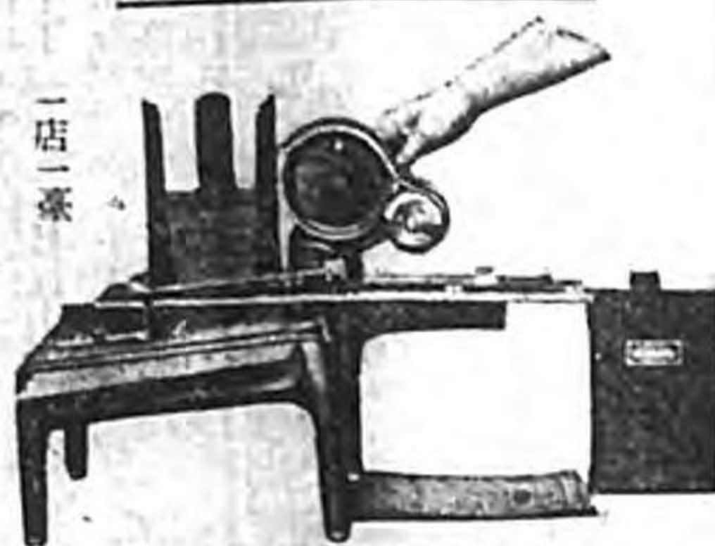
特許 國産75J型名宛印刷器

本品は海外にも輸出する國産名宛印刷器です。ハンドルを廻すごとに次から次へ異なる名宛を順々に刷り出すことが出来ます。外に足踏式もあります。