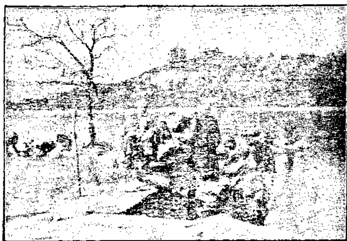
成達師範學校埃及教授遊園和留影

6. 腹與體之端正。即勿食不宜之物，勿存嫉妒，勿懷私怨，使身體勤於善功之謂也。着衣須雅麗；非為競美爭艷，實為昭彰真主之恩惠；動作須莊重，使有條不紊，勿遷延勿暴噪；自能至於處世，易於近主矣！