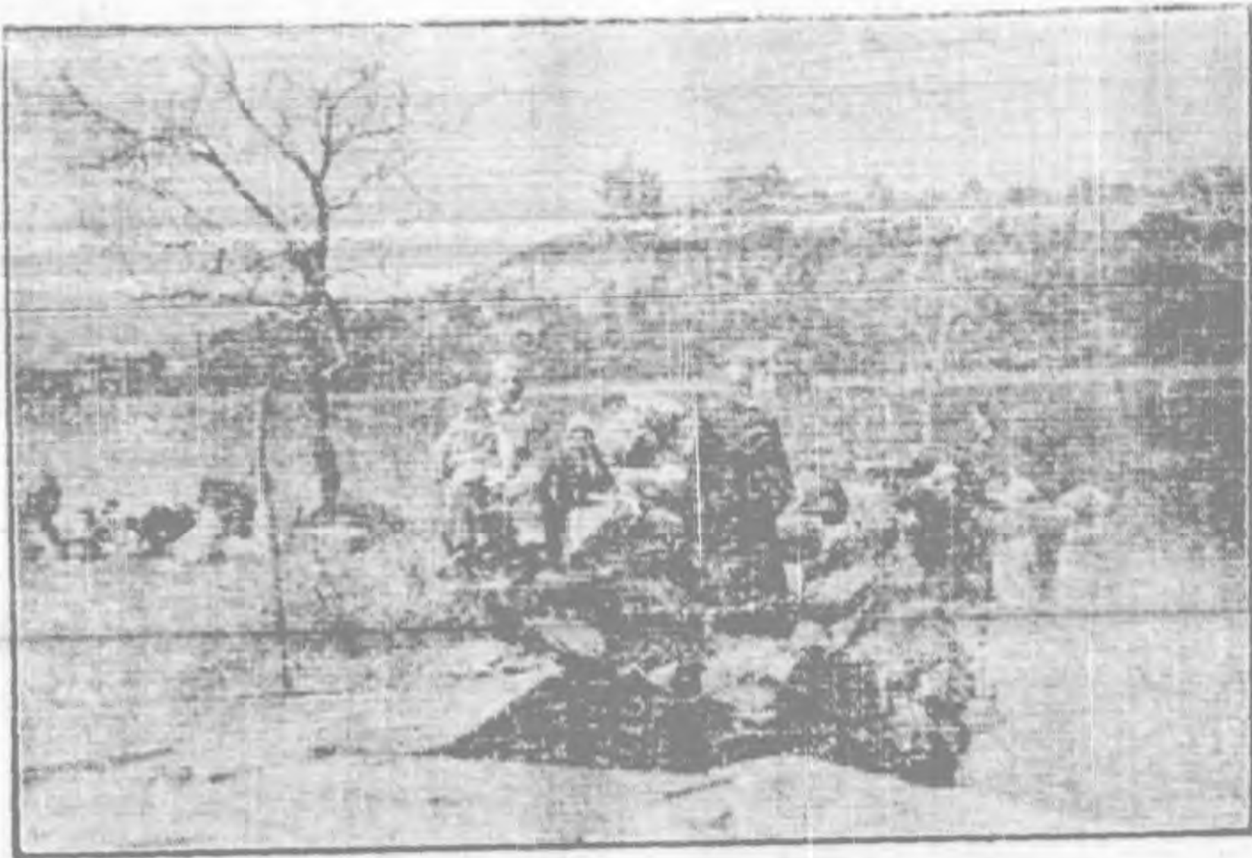
成達師範學校埃及教授遊園和園留影

6. 腹與體之端正。即勿食不宜之物，勿存嫉妒，勿懷私怨，使身體勤於善功之謂也。著衣須雅麗；非為競美爭艷，實為昭彰真主之恩惠；動作須莊重，使有條不紊，勿遲延勿暴曬；自能善於處世，易於近主矣！