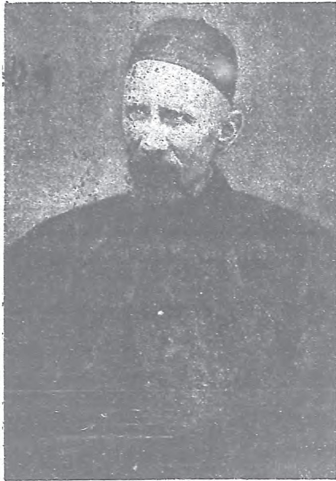
士會言聖，僕忠的主天 父 神 瑟 若 福 號八二月正年八〇九一於卒