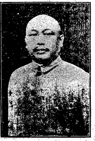
Caption for the portrait image, likely identifying the person shown.