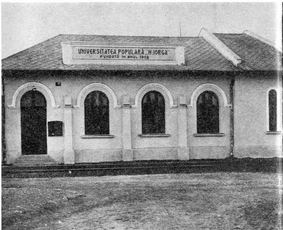
„Universitatea populară” de la Vălenii de Munte