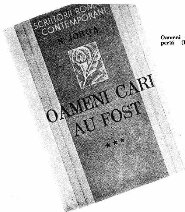
Oameni cari au fost. Copertă (Biblioteca Academiei)