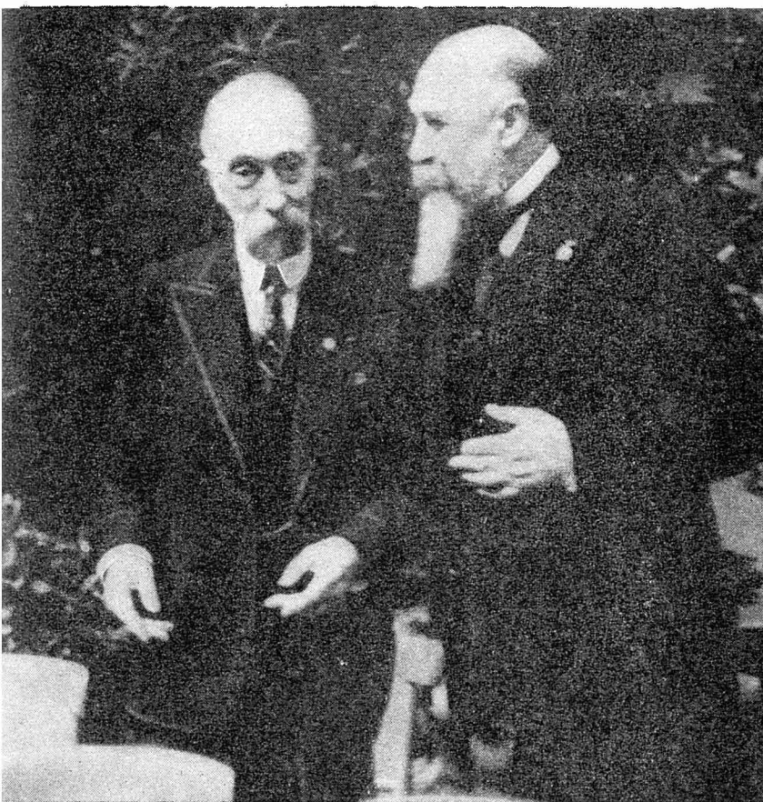
N. Iorga și Charles Diehl, la Congresul de științe istorice din Varșovia, 1933.