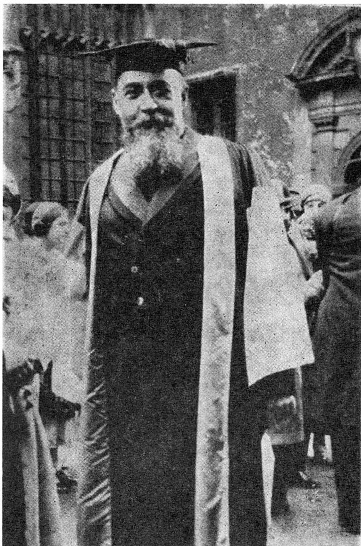
La Oxford, cu prilejul decernării titlului de doctor honoris causa, 1930 (colecția familiei)