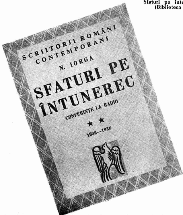
Sfaturi pe întunerec. Copertă (Biblioteca Academiei)