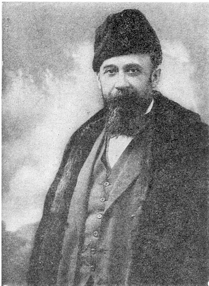
N. Iorga — Portret (colecția familiei)