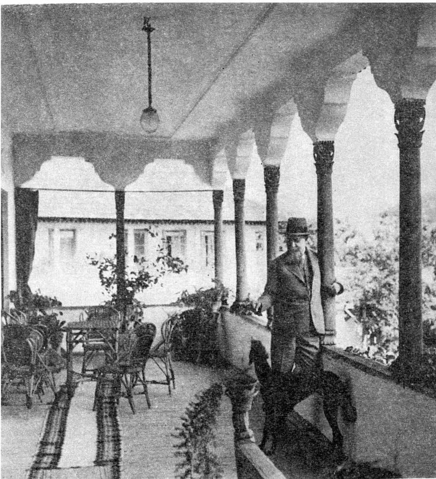
N. Iorga la Vălenii de Munte