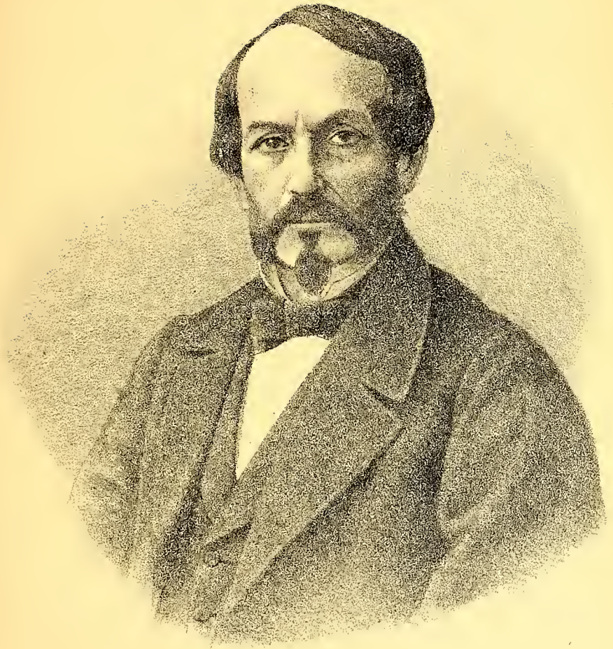
JUAN B. ALBERDI